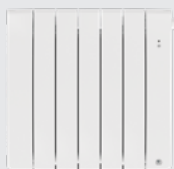
Radiateur(s) connecté(s) (jusqu'à 20 radiateurs)