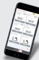
Smartphone avec l'application Cozytouch