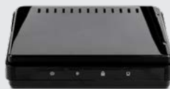
Box d'accès Internet/WIFI