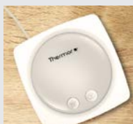
Hub Cozytouch (référence 400992)