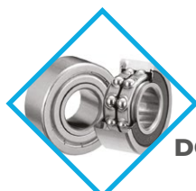
ROULEMENTS À BILLES DOUBLE ÉTANCHÉITÉ