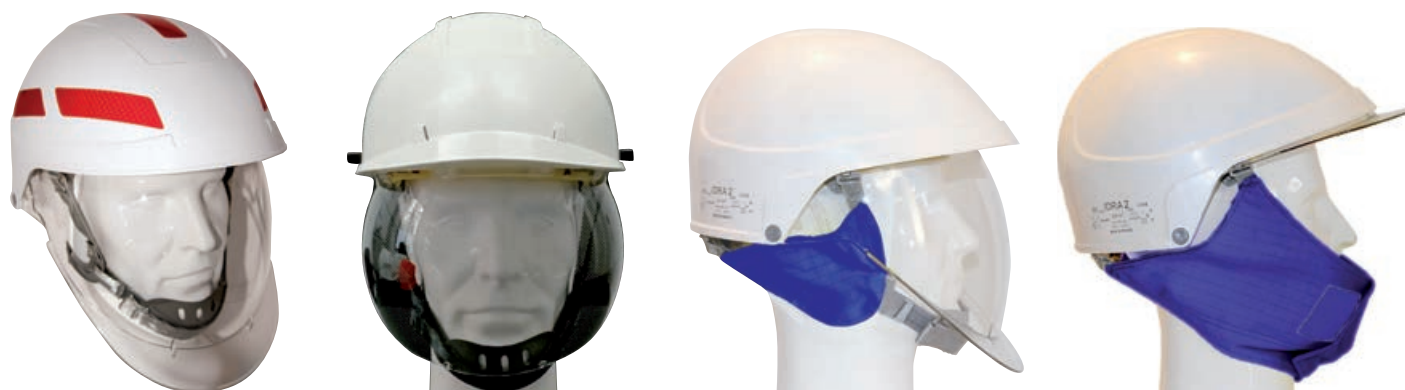
Jugulaire 4 points, grise, avec mentonnière pour casque IDRA 2