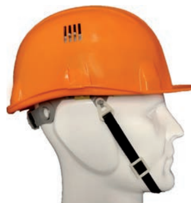
Jugulaire cuir noir 12 mm