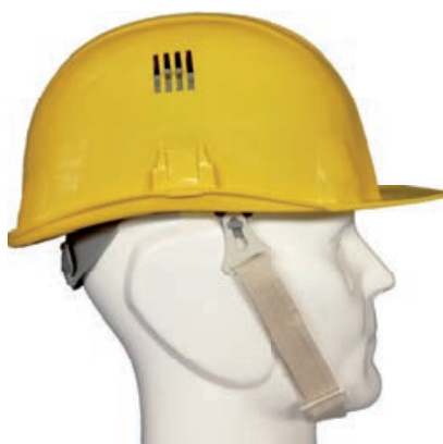
Jugulaire coton écru 20 mm