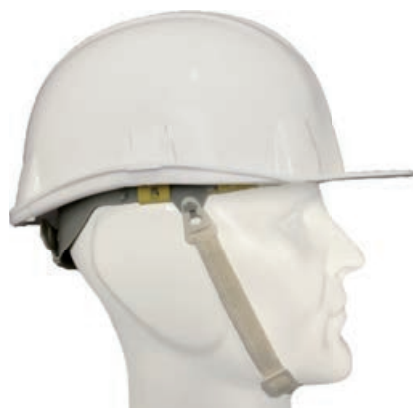
Jugulaire coton écru 12 mm

Rupture des points d'ancrage selon NF EN 397+A1 : 2013.