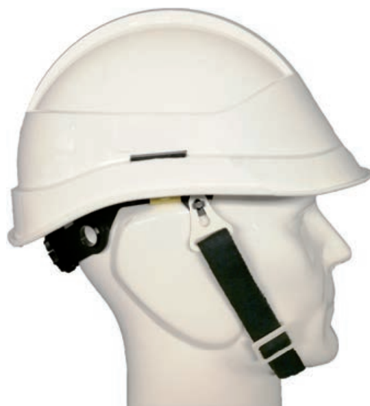
Jugulaire coton noir 20 mm