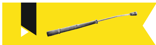
EASY!Lock - M 18 x 1,5

Avec le système EASY!Lock, la jonction à la lance n'est plus assurée par un joint torique axial, mais se fait radialement. Ce procédé accroît la durabilité du joint torique et évite efficacement la perte potentielle de celui-ci.