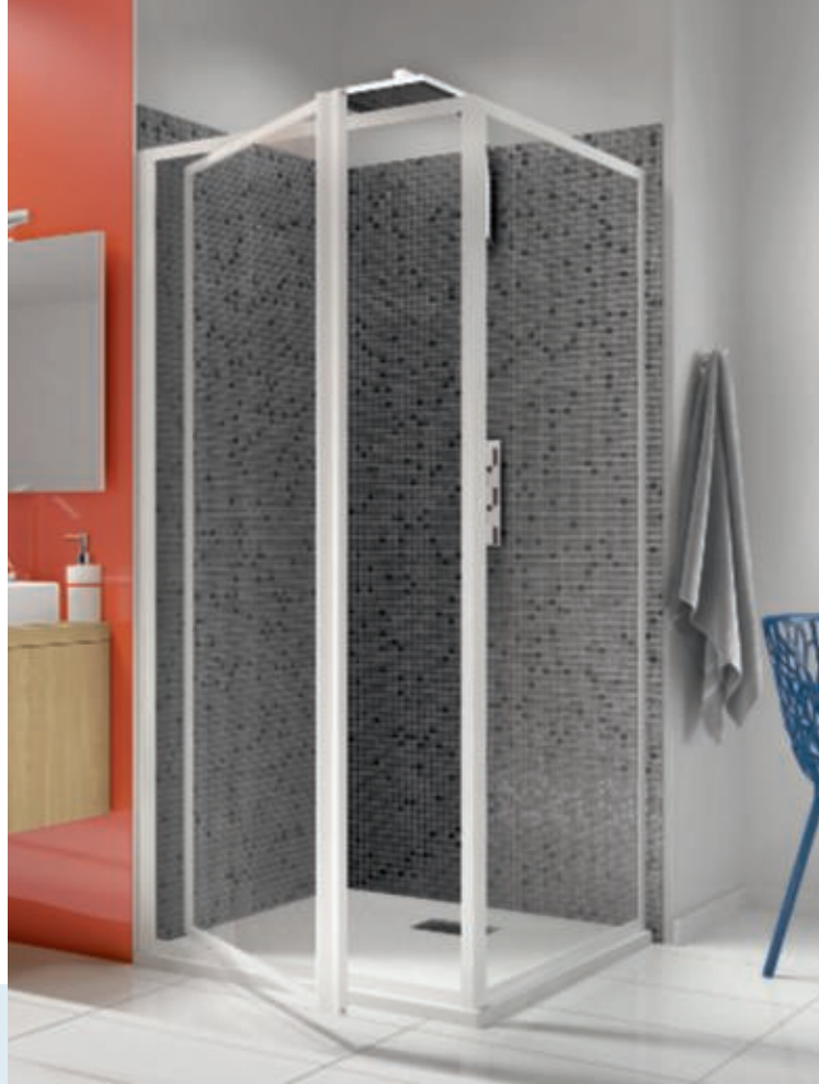
Supra II Fixe - profilé blanc - verre transparent + porte Supra II P