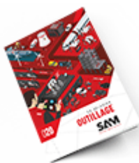
Outillage SAM 2020