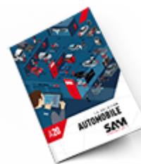
Automobile SAM 2020