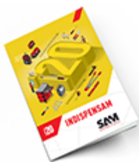
Les outils Indispensables SAM 2020