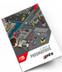
Pneumatique SAM 2020