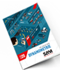
Dynamométrie SAM 2020