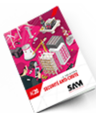
Sécurité anti-chute SAM 2020