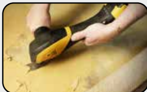
Prise en main 100 % confort bimatière Bimaterial 100 % comfort hand grip