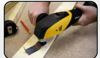
Poignée anti-vibration Anti-vibration handle