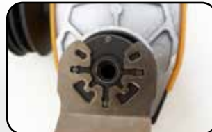
Empreinte compatible Compatible fastening