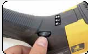
Molette de vitesse variable Variable speed with pre-selected gear wheel