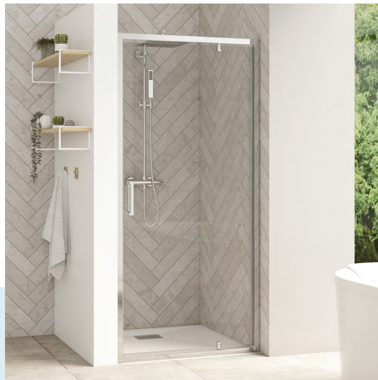
Smart Design P (taille ≤ 100 cm) - profilé chromé