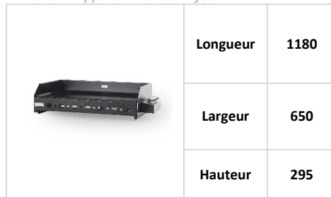
Annexe 1 : Appareil Plancha 4 feux