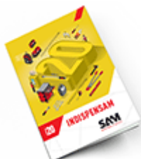
Les outils Indispensables 2020

Découvrez tous nos produits dans nos catalogues en ligne