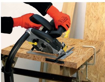
Base inclinable / profondeur réglable Tilting base / adjustable depth