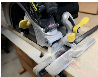
Visée laser Laser target

Livrée avec lame 36 dents montée, guide parallèle, clé, 2 piles et collecteur de poussières Delivered with mounted 36 T blade, parallel guide, wrench, 2 batteries and dust connector