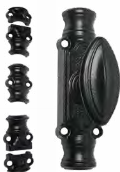
J.. RY16 bouton standard