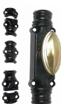
J041373 RY16 bouton laiton lisse