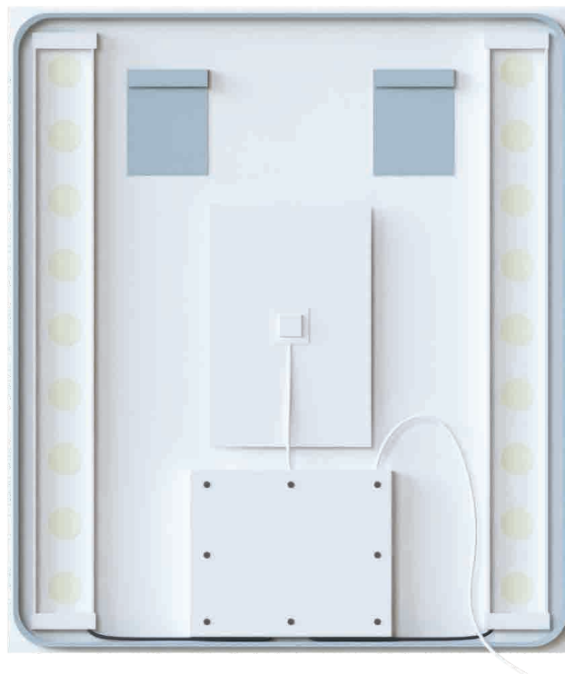
Ci-dessus : face arrière du miroir Starled Ci-contre : détail du boîtier LED interchangeable