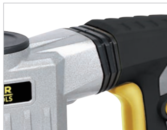
Poignée anti-vibration Anti vibrations system