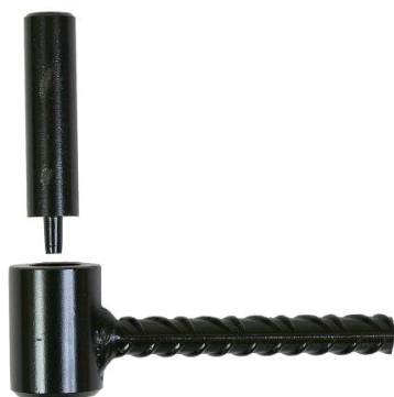
Gond parpaing Ø 10 x 80