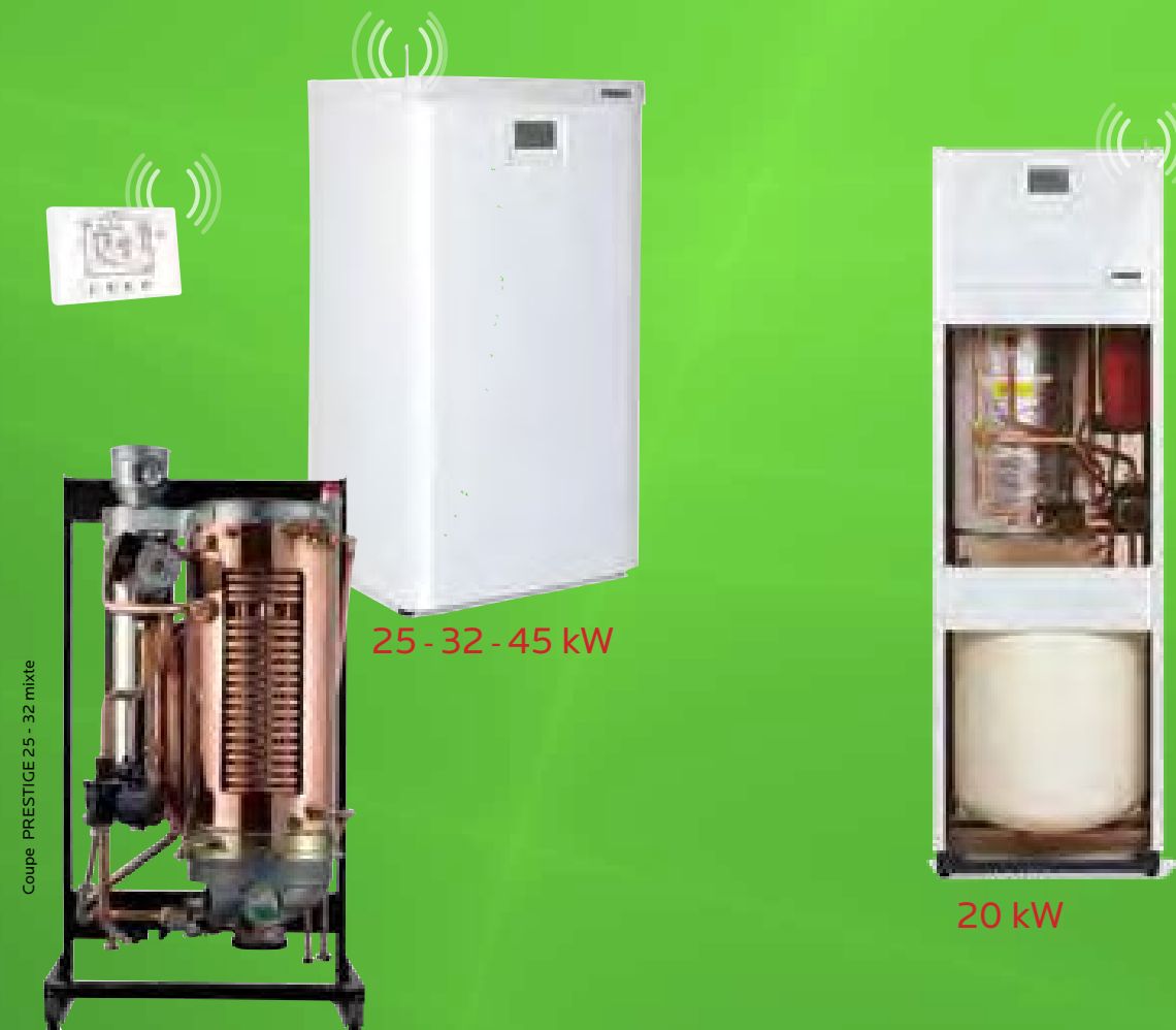
Coupe PRESTIGE 25 - 32 mixte