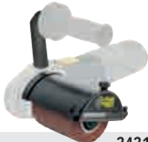
Rénovateur - Renovator MR 900-REX