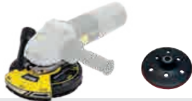
Ponceuse plâtre - Plaster sander MR 900-SH