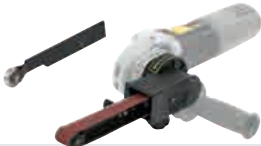
Ponceuse lime - Electric file MR 900-EFH