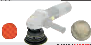
Ponceuse orbitale/ polisseuse Polisher MR 900-PP