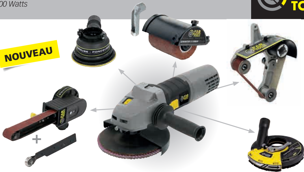
Ponceuse tube - Tube sander MR 900-TS