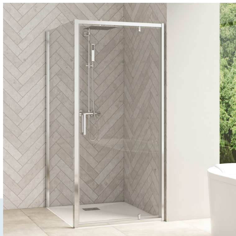
Smart Design Fixe - profilé chromé + porte Smart Design P