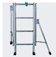
Utilisation possible contre un mur