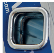
Ultra-résistance de l'échelon grâce au triple sertissage