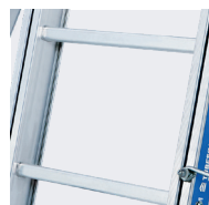
Échelons 30 x 30 mm