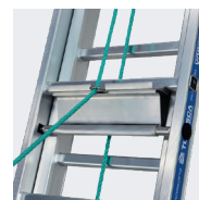
Coulisse à corde avec basculeur automatique en alu extrudé