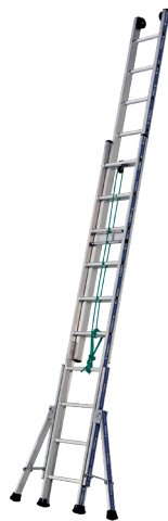
Modèle 2x10 échelons

L'échelle Platinum 300 coulisse à corde 2 plans en aluminium est la référence à coulisse corde du marché. Composée de 2 plans elle permet d'accéder jusqu'à 12,84 m. Ses stabilisateurs latéraux réglables, ses sabots enveloppants haute sécurité, ses montants extra larges garantissent sécurité et résistance. Elle répond aux normes EN 131, au décret 96333. Elle est labellisée NF.