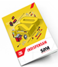
Les outils Indispensables SAM 2020

Découvrez tous nos produits dans nos catalogues en ligne