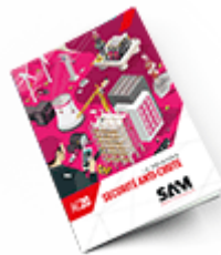
Sécurité anti-chute 2020