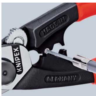
Sertissage de l'embout sur le câble tracteur