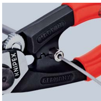
Sertissage des embouts sur les gaines Bowden

Guidage précis grâce à une charnière vissée