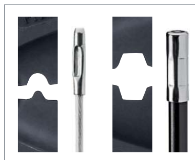
Profils de sertissage

Sécurité transport et limitation d'ouverture