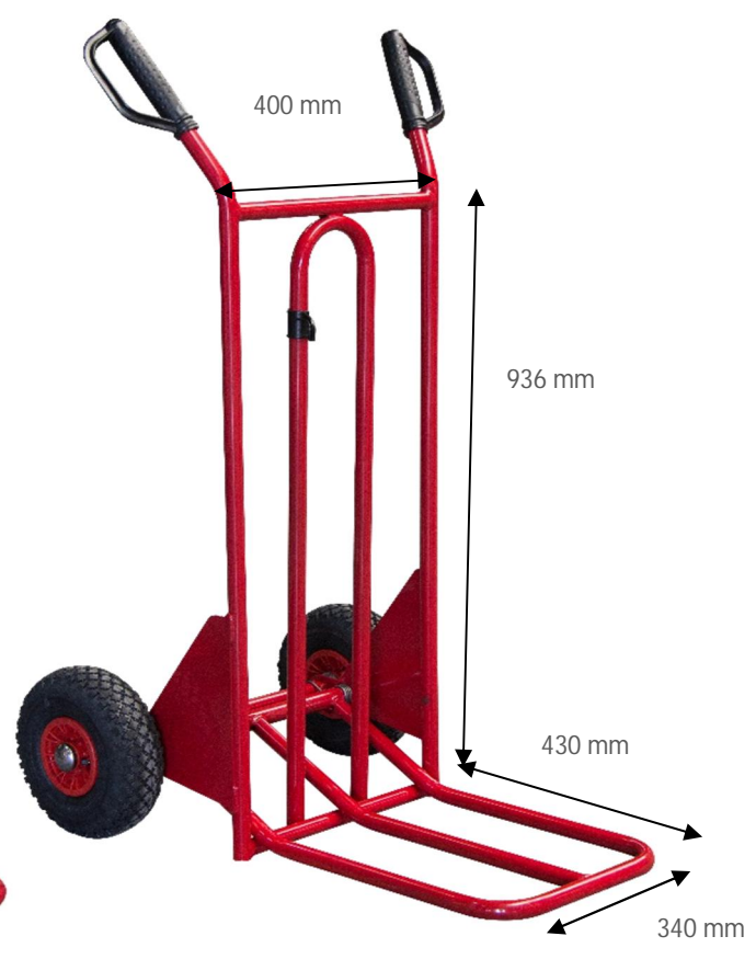
Diable BASCULEMENT ASSISTÉ