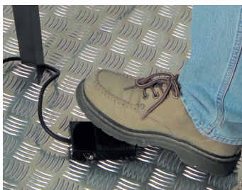
Démarrage au pied Foot start

Livrée avec son support, lampe, souffleur et une lame Delivered with support, lighting system, blower and one blade