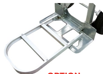
OPTION Bavette rabattable 500x300 mm