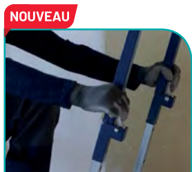
NOUVEAU Réglage de la hauteur + facile, + intuitif et + durable. BREVETÉ