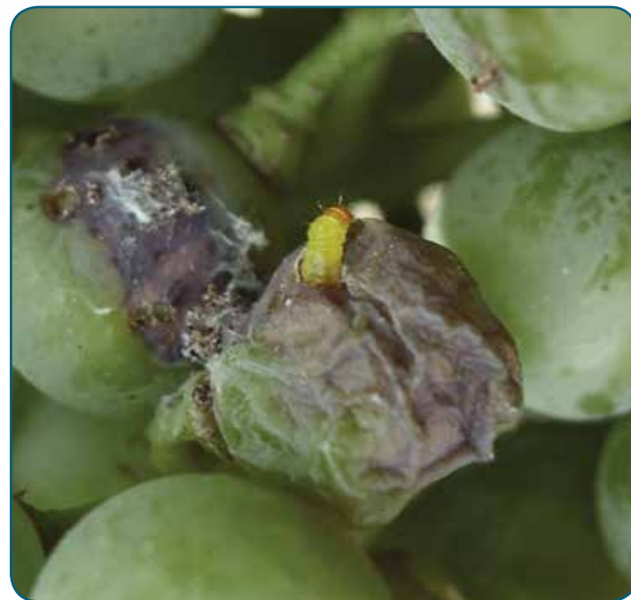
Larva di Lobesia botrana su vite

Il meccanismo d'azione dipende anche da diversi fattori, quali il pH intestinale alcalino, tipico delle larve di lepidotteri, la presenza di determinati enzimi digestivi, specifici recettori delle tossine (che variano a secondo dell'insetto-bersaglio) e lo stadio di sviluppo dell'insetto (le larve giovani sono più suscettibili).