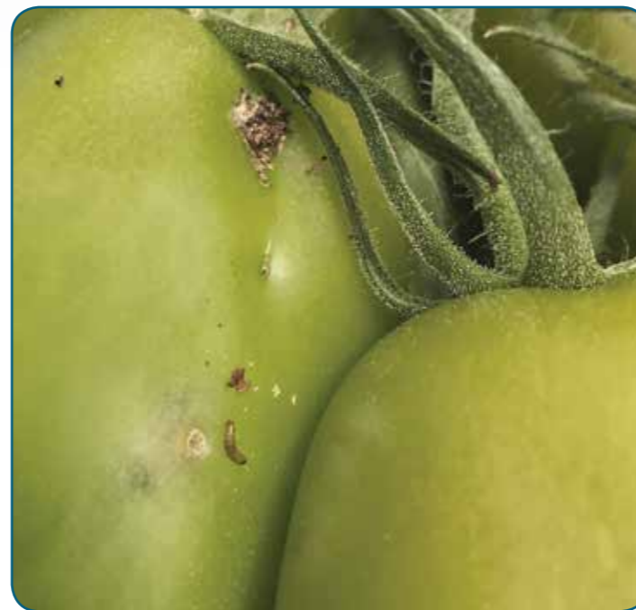
Larva di Tuta absoluta su pomodoro