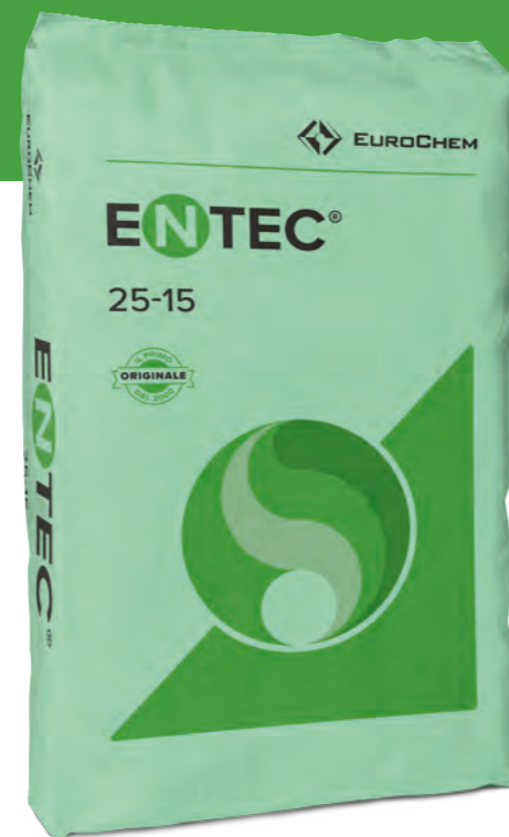
Disponibile in sacchi da 25 kg, 50 kg e big bag da 600 kg