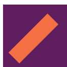
TABLE RONDE: UN AN APRÈS...

Places limitées, inscription obligatoire, session ouverte à tous à partir de 15 ans.