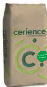
Conditionnement : Sac de 15 kg