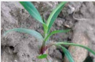
Agrostis jouet du vent Apera spica-venti

(1) Pas d'adjuvantation sur orge d'hiver en association avec d'autres partenaires