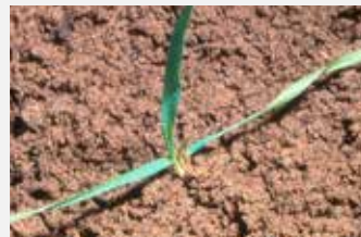
Folle Avoine Avena sp.