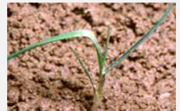
Vulpin Alopecurus myosuroides