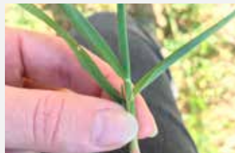
Phalaris Phalaris paradoxa