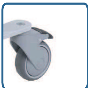
Koła o niskim tarciu

Mocowanie podwieszki: Minimalny nacisk skierowany w dół zamyka hak podwieszki; w celu otwarcia haka pod- wieszki pociągnąć w górę