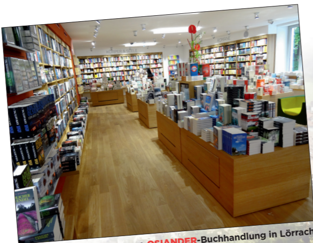
Die neue OSIANDER -Buchhandlung in Lörrach

Mitte Juni 2015 war es endlich soweit: Nach achtzehn Monaten Umbau wurde in Lörrach die 34. OSIANDER -Buchhandlung eröffnet. Mehrmals musste der Eröffnungstermin verschoben werden, weil es immer wieder unerwartete bauliche Verzögerungen gab. Ein Teil der Mitarbeiter, der schon eingestellt war, musste vorübergehend in anderen OSIANDER -Buchhandlungen untergebracht werden. Das lange Warten hat sich aber gelohnt: Heute steht in Lörrach die für viele Kunden modernste und schönste OSIANDER -Buchhandlung.