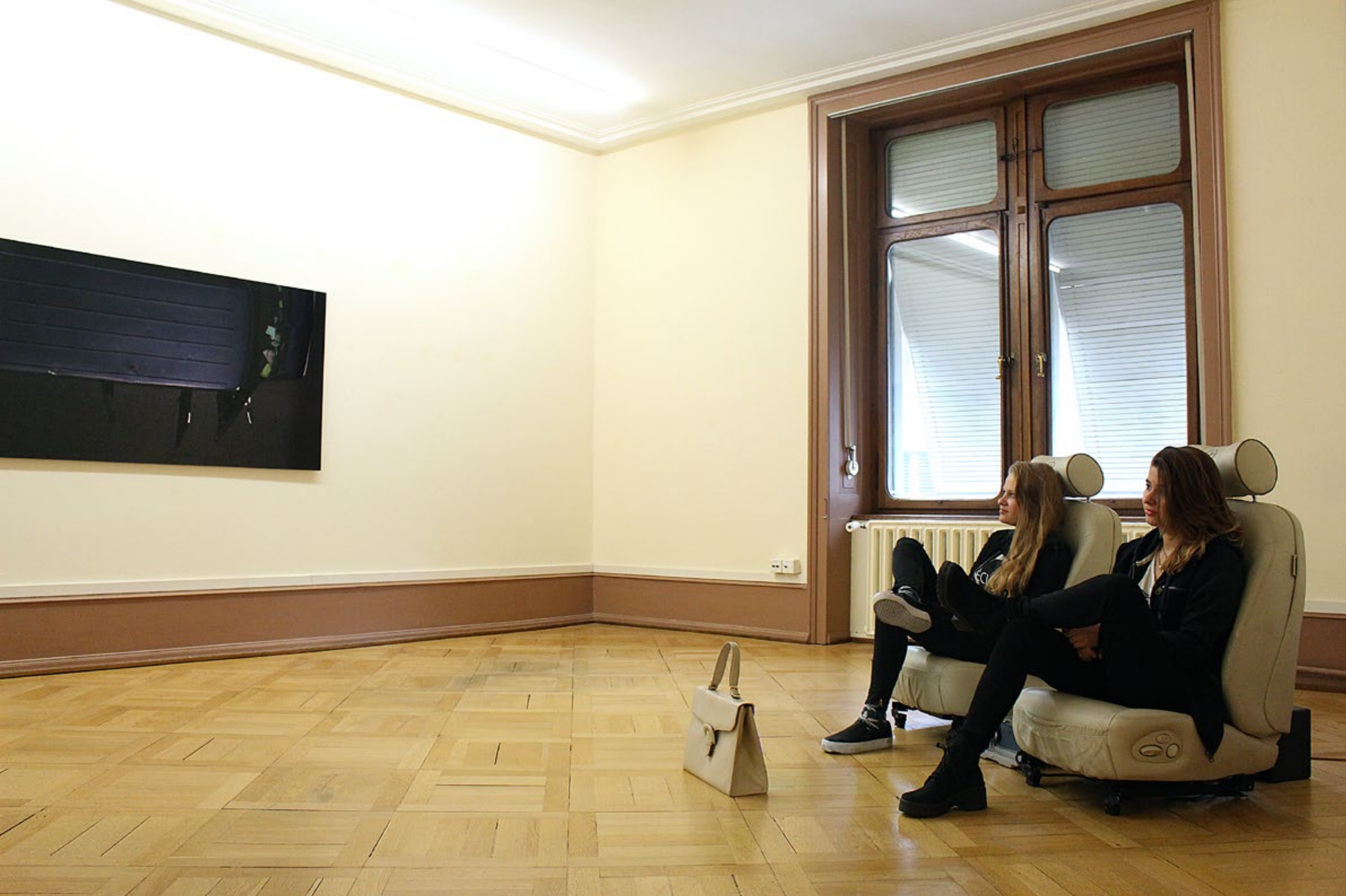
Brigitte Friedlos, truck body [clear #3], 2003, C-Print auf Dibond, the moving dress, 2003, Video-Rauminstallation, Installationsansicht Obergeschoss, Villa Renata, Basel, Foto: Zarah Leemann