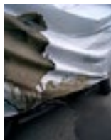
Brigitte Friedlos, Auslauf, 2013, C-Print auf Dibond (6mm), 900x715mm