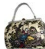
Brigitte Friedlos, Denk- und Bewegungsraum immer dabei, 2010, Objekt, Handtasche