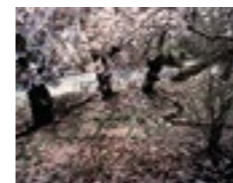
Brigitte Friedlos, burst into blossom, 2014, C-Print auf Dibond (6mm), 1435x1805mm, Centralpark