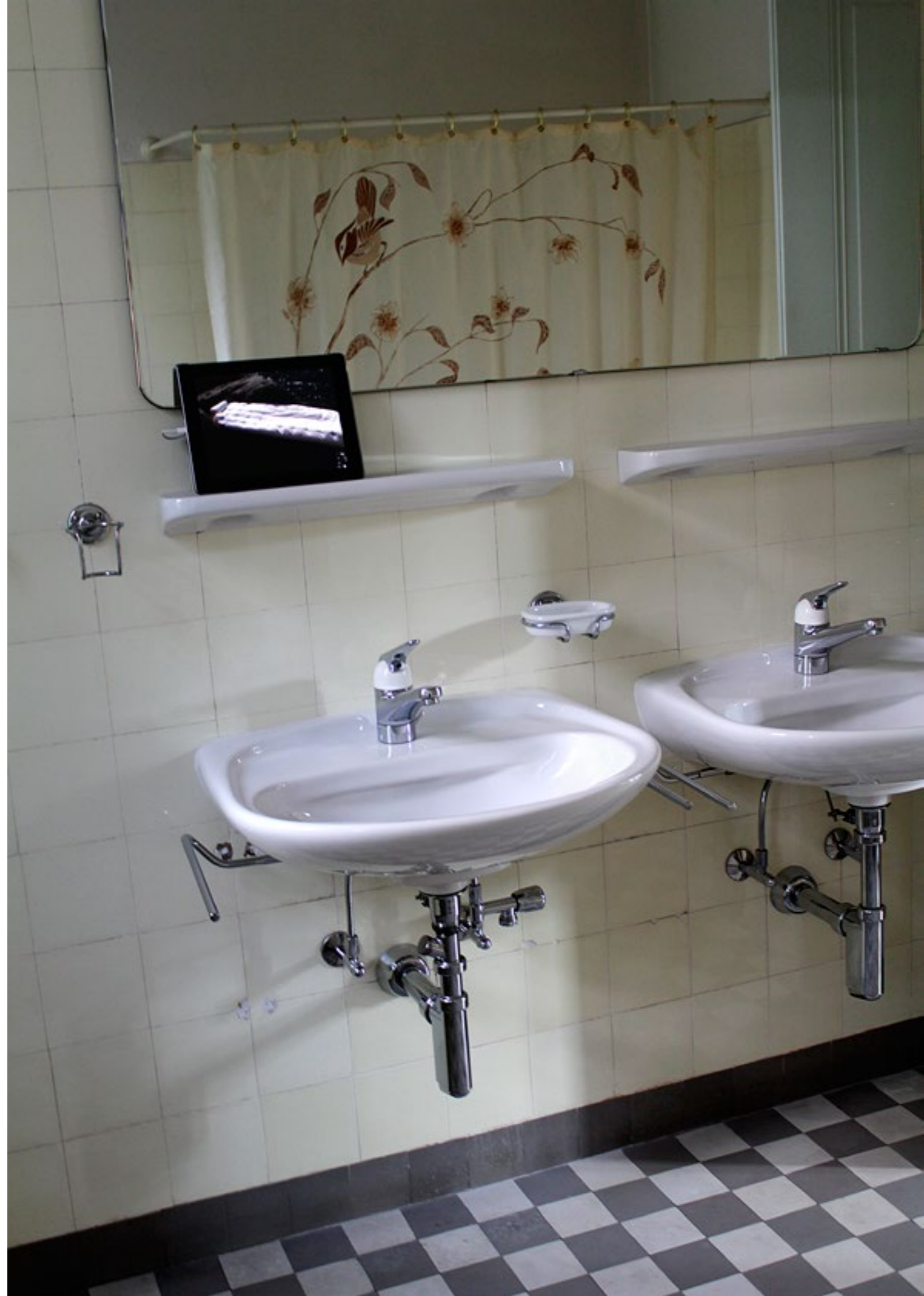
Brigitte Friedlos, 5955 feet, 2004, Video, Installationsansicht Obergeschoss, Villa Renata, Basel