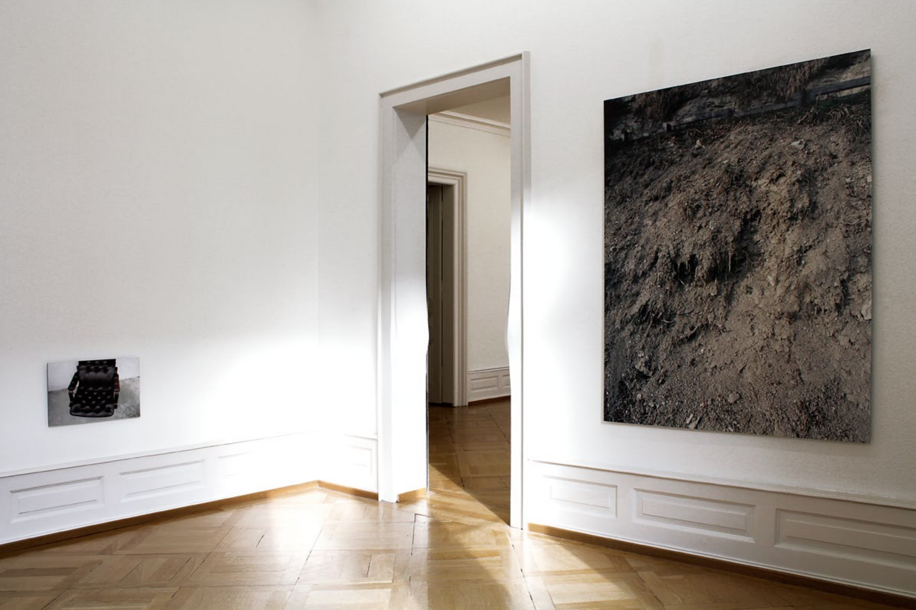
Brigitte Friedlos, Treffen, 2008, Lagerung und Abtragung, 2011, C-Prints auf Dibond, Installationsansicht Erdgeschoss, Villa Renata, Basel