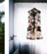
Brigitte Friedlos, von aussen betrachtet, 2010, C-Print auf Dibond (6mm), 450x380mm