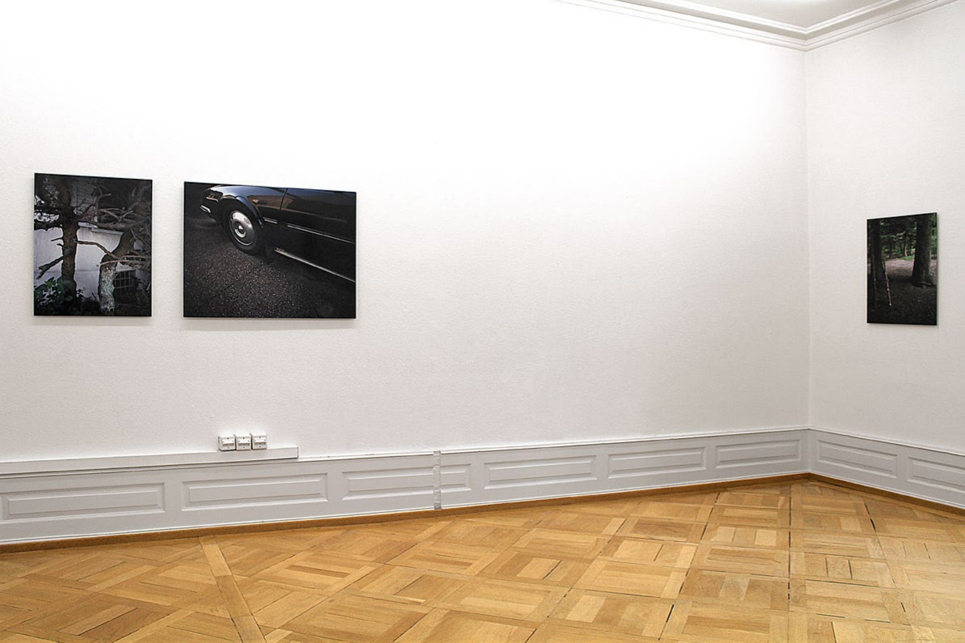
Brigitte Friedlos, nur ein Wimpernschlag entfernt, 2013, Nachhall, 2013, entbundene Sprossen, 2013, C-Prints auf Dibond, Installationsansicht Erdgeschoss, Villa Renata, Basel