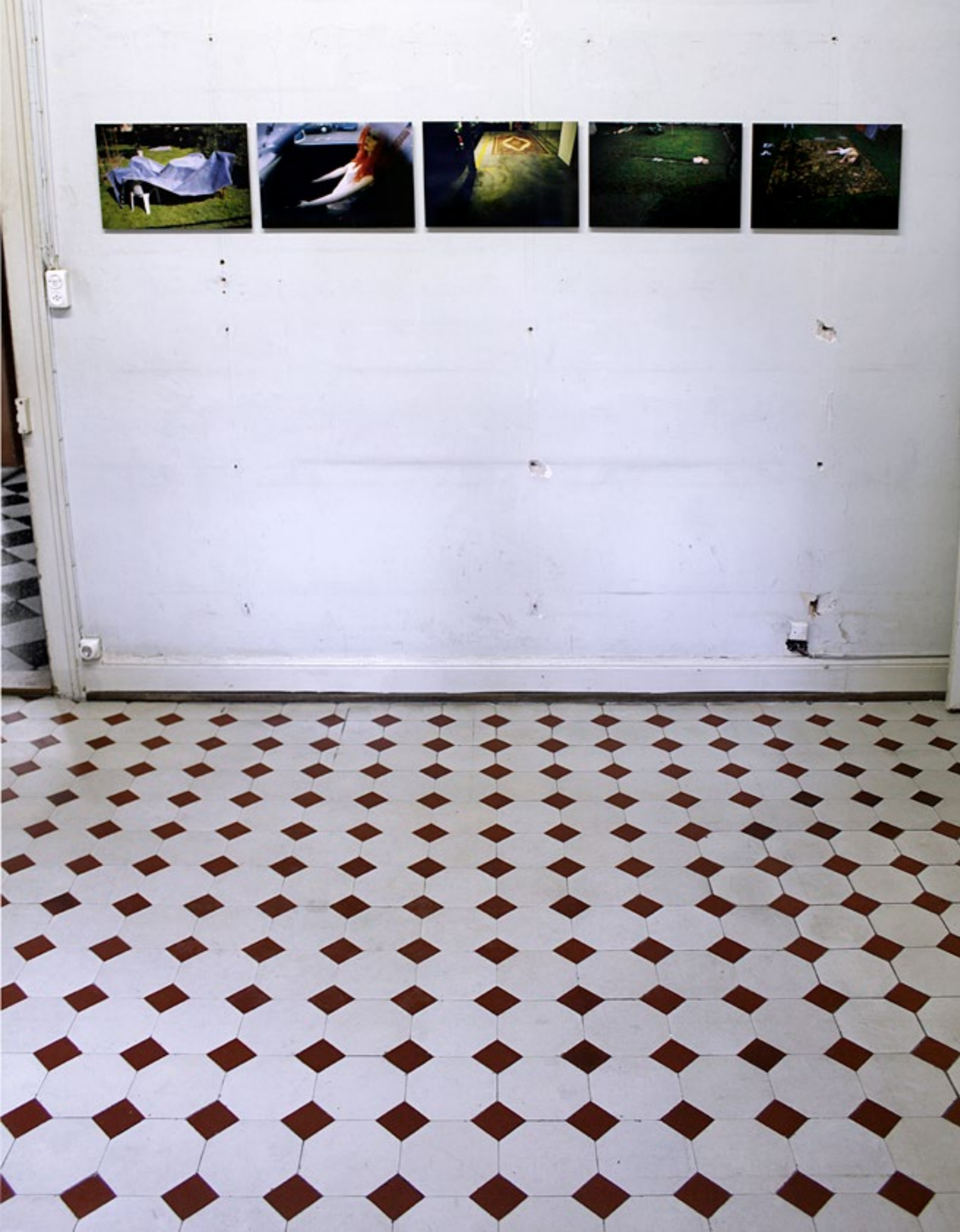
Brigitte Friedlos, Ahnungen zu geortet, 1999, C-Prints auf Dibond, fünfteilig, Installationsansicht Erdgeschoss, Villa Renata, Basel