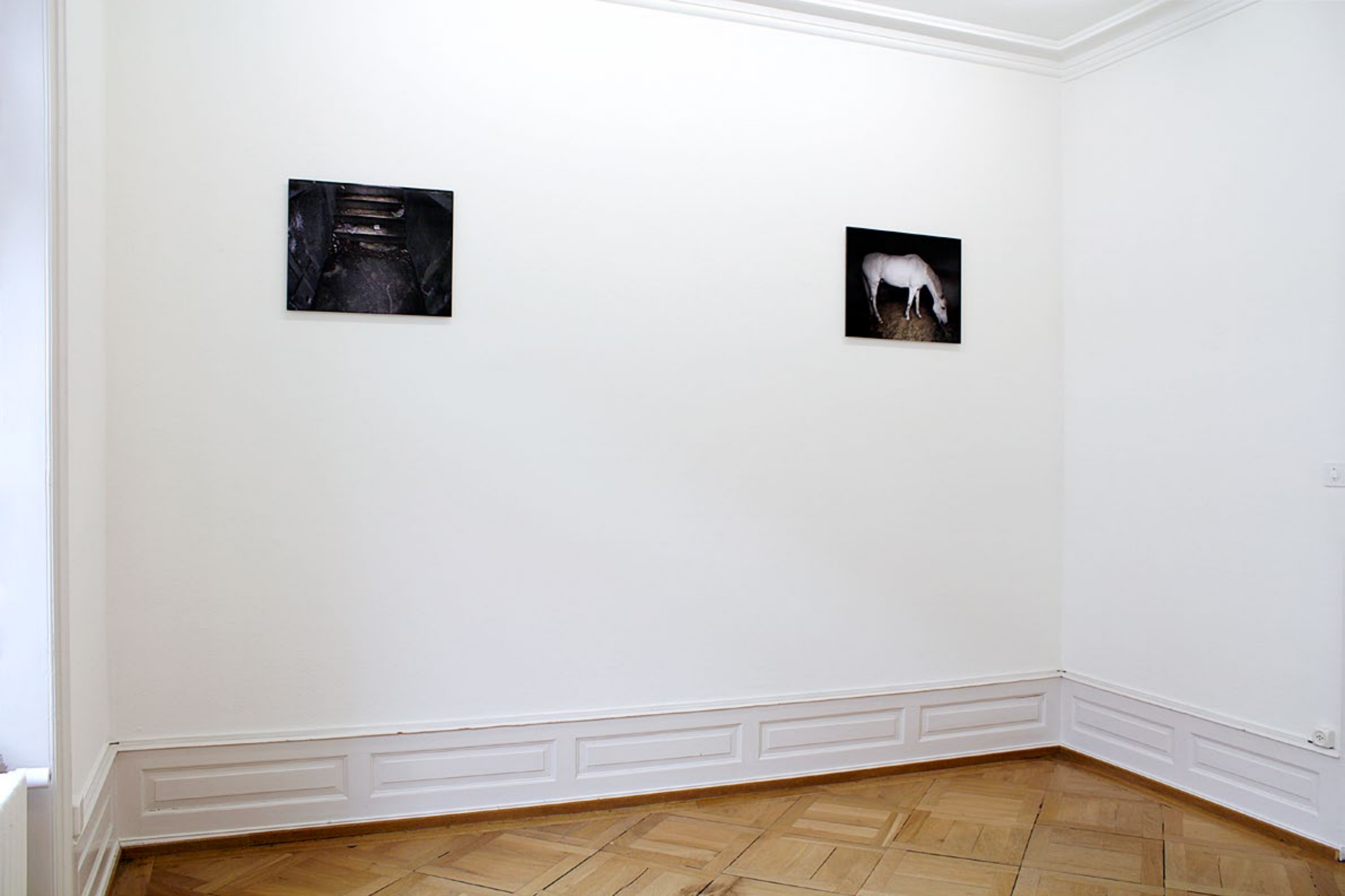
Brigitte Friedlos, Grund [Sichtung], 2010, Grund [Nahrungsaufnahme], 2010, C-Prints auf Dibond, zweiteilig, Installationsansicht Erdgeschoss, Villa Renata, Basel