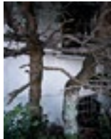
Brigitte Friedlos, nur ein Wimpernschlag entfernt, 2013, C-Print auf Dibond (6mm), 685x545mm