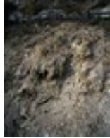
Brigitte Friedlos, Lagerung und Abtragung, 2011, C-Print auf Dibond (6mm), 1390x1100mm