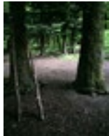
Brigitte Friedlos, entbundene Sprossen, 2013, C-Print auf Dibond (6mm), 685x520mm