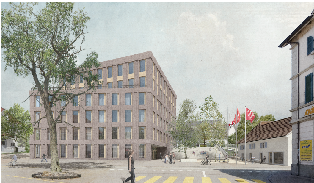
Sicht auf den Hauptzugang mit Vorplatz und Däge-Lädeli