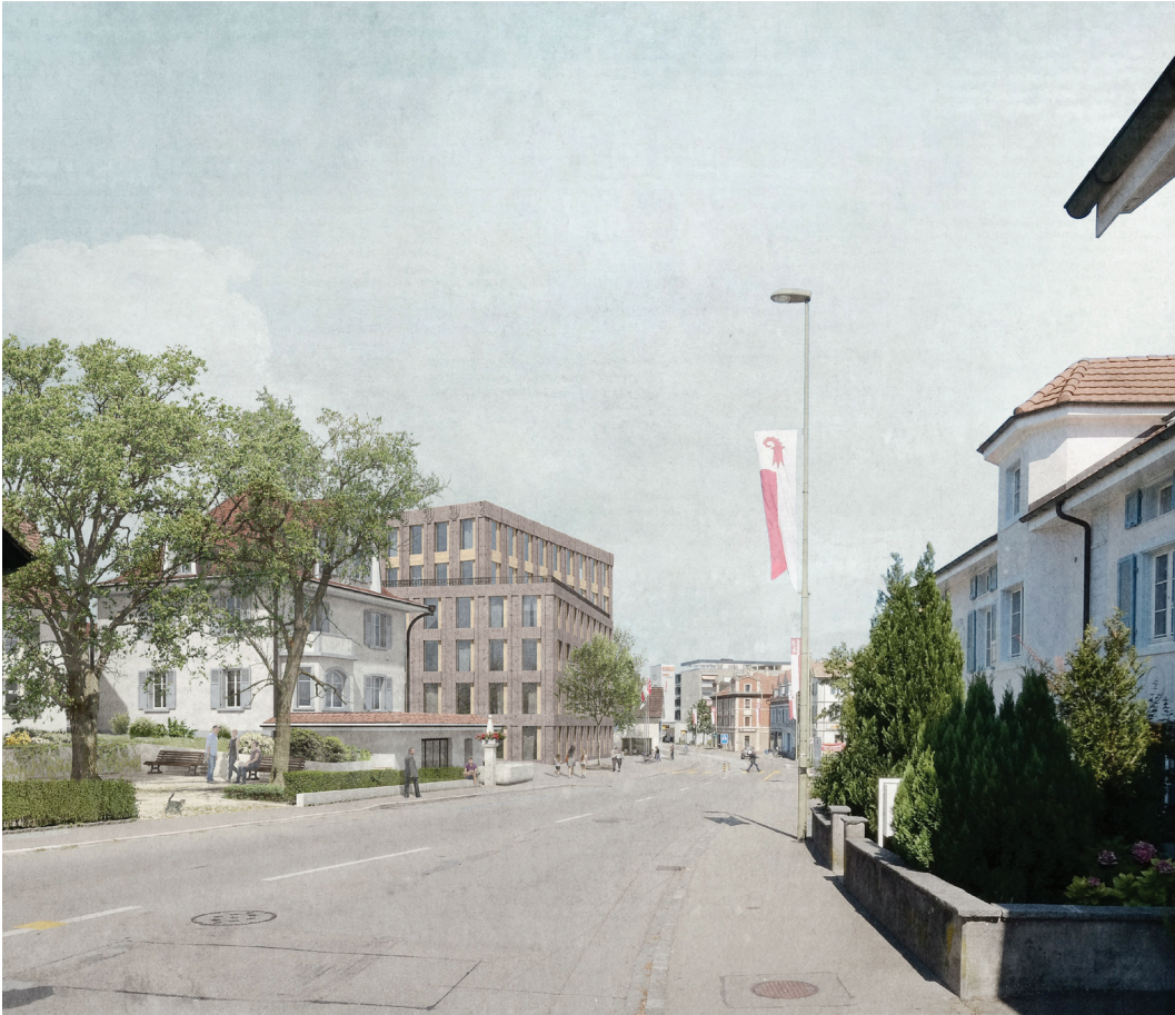
Sicht von der Hauptstrasse Fahrtrichtung Bottmingen (Bild: BGM Architekten GmbH)