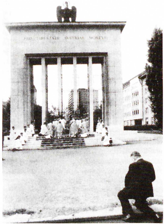
Fronleichnamsprozession 1978 mit Bischof Paulus Rusch. Kniend Landeshauptmann Eduard Wallnöfer

aufhalten können. Es ging jedoch nicht darum, etwa eine italienische Piazza durch die Verwendung von Natursteinplatten nachzuahmen. Die Materialwahl, die auch auf ein interessantes, spannungsgeladenes Subthema verweist, fiel auf Beton und stellte eine gewaltige technische Herausforderung dar. Die in Beton gegossene Bodenplastik erweist sich nicht nur als futuristische Landschaft, die völlig neue Ausblicke und Perspektiven ermöglicht im Vergleich zur bisherigen einschüchternden Geschlossenheit des Platzes, der 1972 durch den Bau des Hochhauses des Hotels „Holiday Inn“ (heute „Hilton“ und Casino) seinen einzigen schönen Ausblick verlor. Sie verweist in ihrer äußeren Beschaffenheit auf eine Schwemmlandchaft und erinnert daran, dass die Stadt Innsbruck auf einem derartigen Schwemmland gebaut wurde. 2