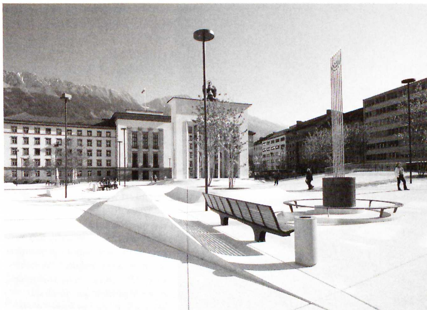
Täterbau, Widerstandsdenkmal und Opfermahnmal: Durch die Neugestaltung des Platzes mit der Versetzung des Pogromdenkmals entstand eine inhaltlich erkennbare Erinnerungslandschaft mit Bezug auf den Nationalsozialismus.