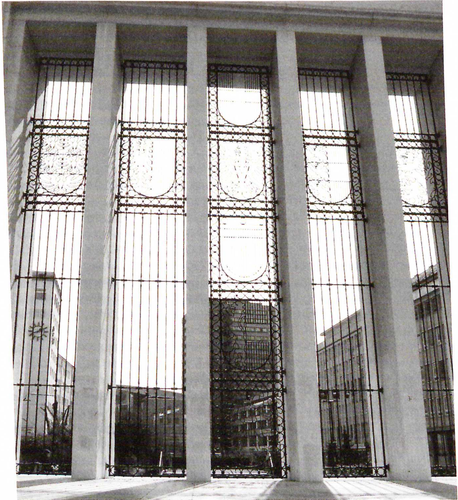
Nahaufnahme der schmiedeeisernen Gitter der österreichischen Bundesländer in Form eines Kreuzes. Der Widerstand gegen den Nationalsozialismus in Tirol wurde so der katholischen Kirche zugeschrieben.

Als die französischen Truppen im Juli 1945 die US-Streitkräfte als Besatzungsmacht in Tirol und Vorarlberg ablösten, fasste der Chef der französischen Militärregierung, Pierre Voizard, den Plan zum Bau eines Befreiungsdenkmal. Es sollte an die Tiroler WiderstandskämpferInnen und die gefallenen alliierten Soldaten erinnern, die ihr Leben für die Freiheit Österreichs opferten. Der Bebauungsvorschlag von Major Jean Pascaud, dem Architekten der französischen Militärregierung, sah das Denkmal in der Mitte einer Parkanlage vor. Für den Bau wurden die Häuser des ins Auge gefassten Areals, die größtenteils während der Bombenangriffe auf Innsbruck beschädigt worden waren, bis zur Salurner Straße abgetragen. Die