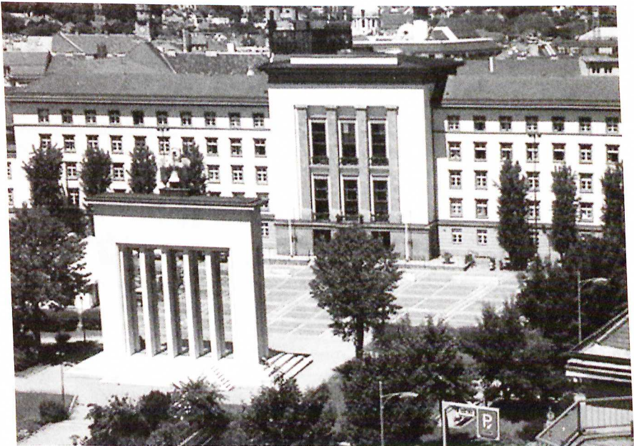
Der Portalbereich des NS-Repräsentationsbaus wird im Befreiungsdenkmal gespiegelt.

Das Neue Landhaus wurde 1938/39 als Gauhaus errichtet, in dem die national-sozialistische Regierung des Gaues Tirol-Vorarlberg und die verschiedenen Organisationen der NSDAP ihren Sitz hatten. Das pompös-monumentale Gauhaus stellt den bedeutendsten Repräsentationsbau der NS-Zeit in Tirol dar. Ein Hinweis auf diese Baugeschichte in Form einer Erklärungstafel fehlt bis heute. Der Nazi-bau wartet noch auf eine architektonisch-künstlerische Intervention, die eine zeitgenössische Antwort auf seine imperial-faschistische Architektur gibt.