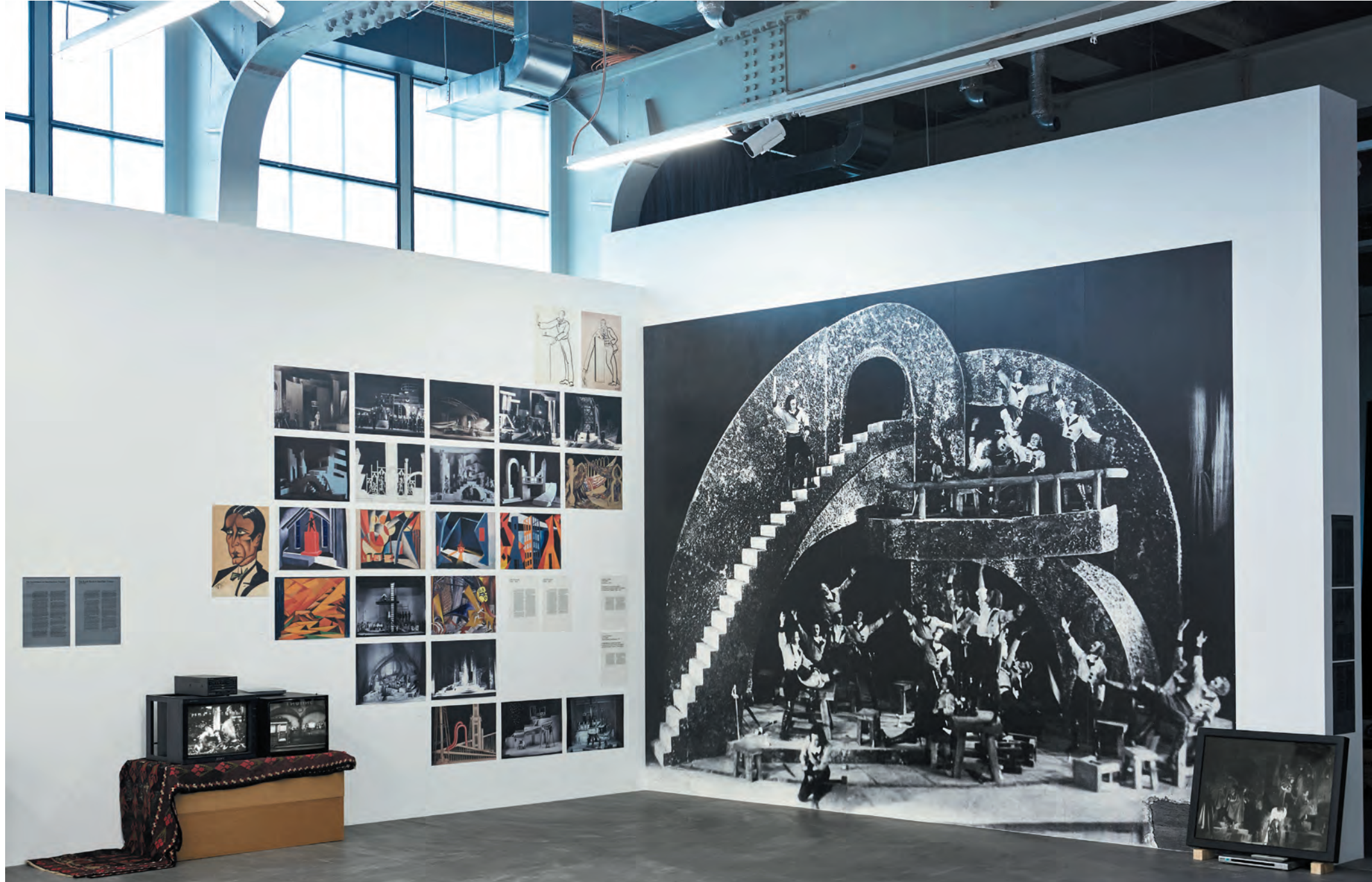
Kunsthalle Zürich - Georgischer Modernismus: Die Fantastische Taverne