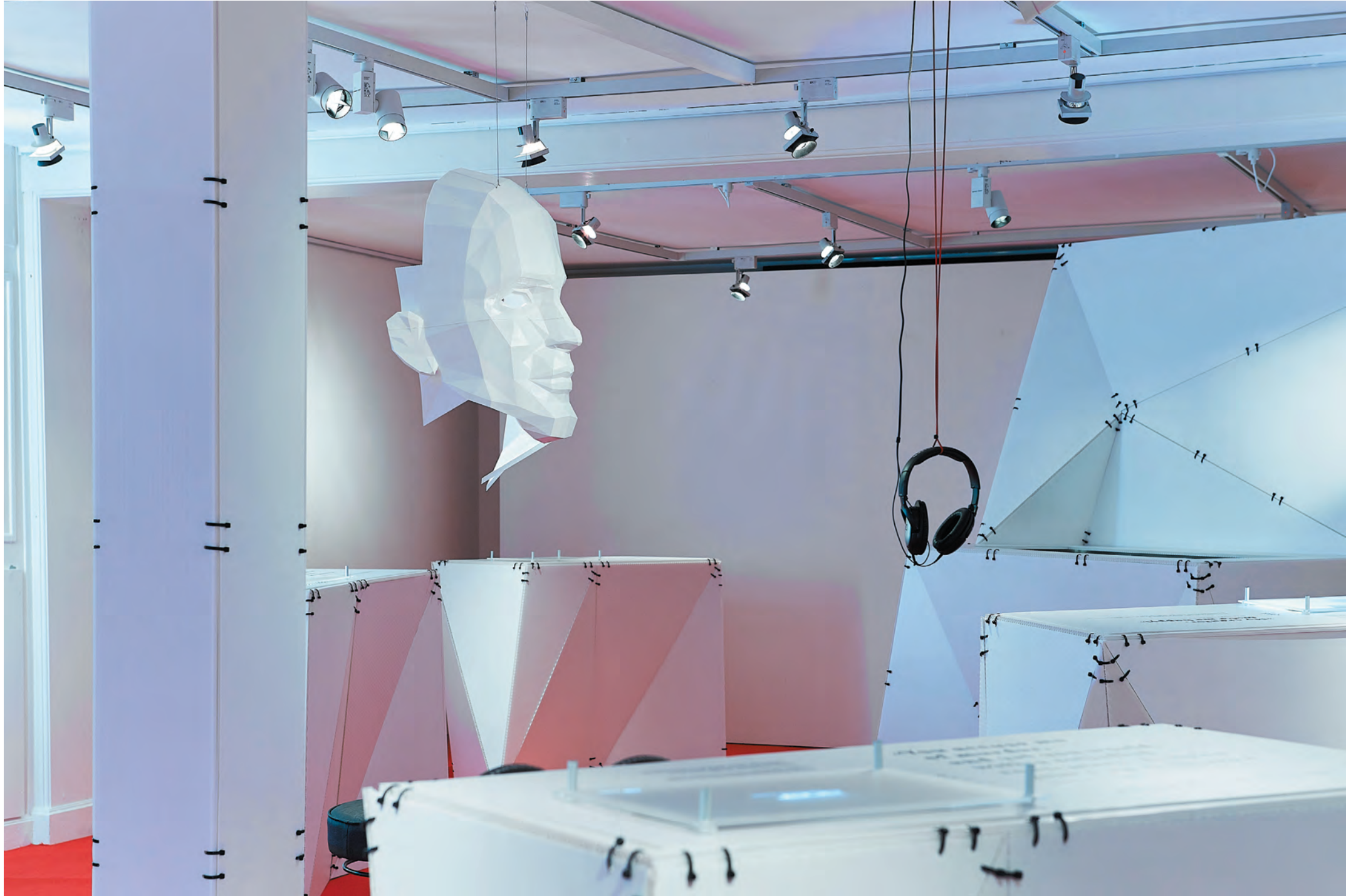
Strauhof Zürich - Frankenstein - Von Mary Shelley zum Silicon Valley