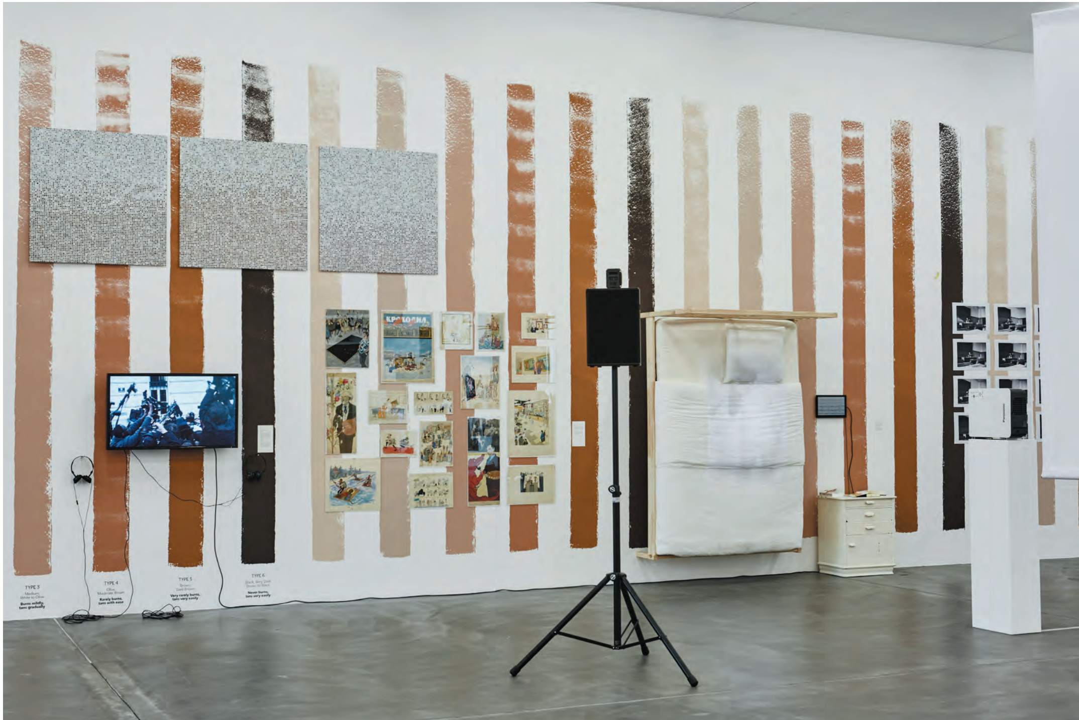
TYPE 3 Medium White to Olive Burns mildly, tans gradually