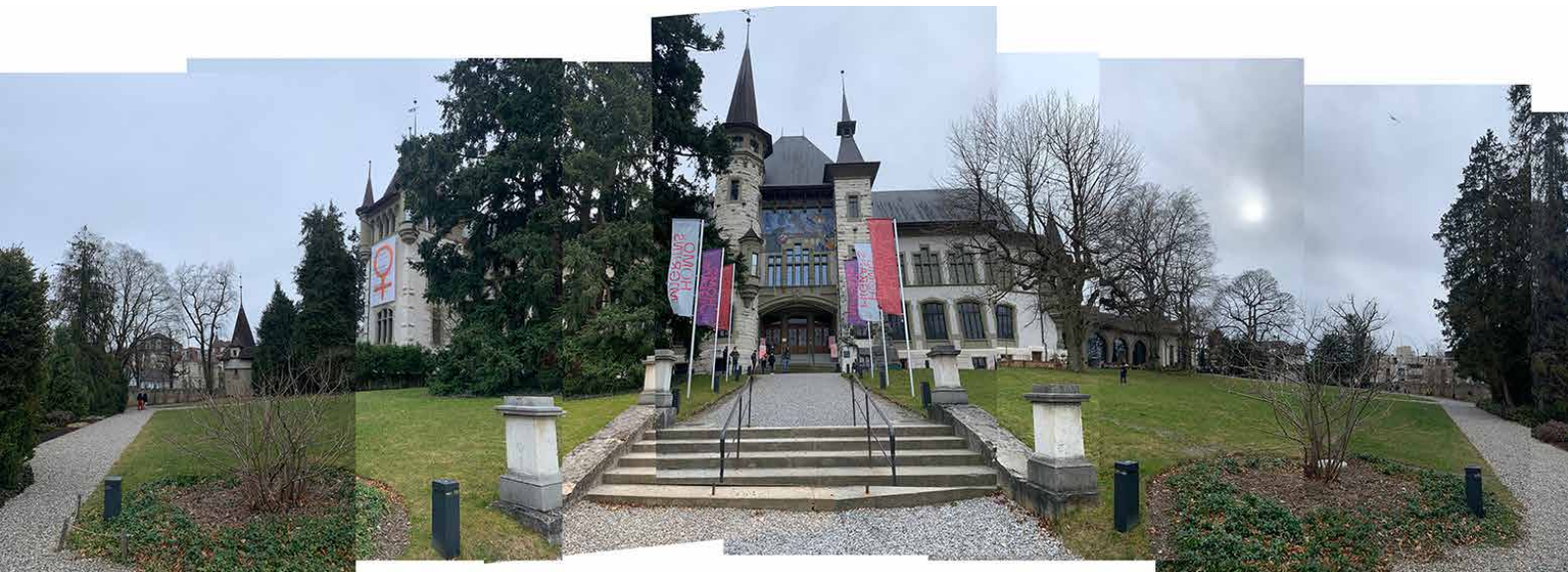
Abb.19: Berner Historisches Museum