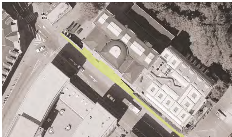
Abb.13: Raum vor dem Kunstmuseum Bern - Ist und Soll-Situation

Räume vor einem Museum werden, wie bereits erwähnt, ganz stark städtebaulich beeinflusst. Im Gespräch erwähnt Beat Schüpbach die