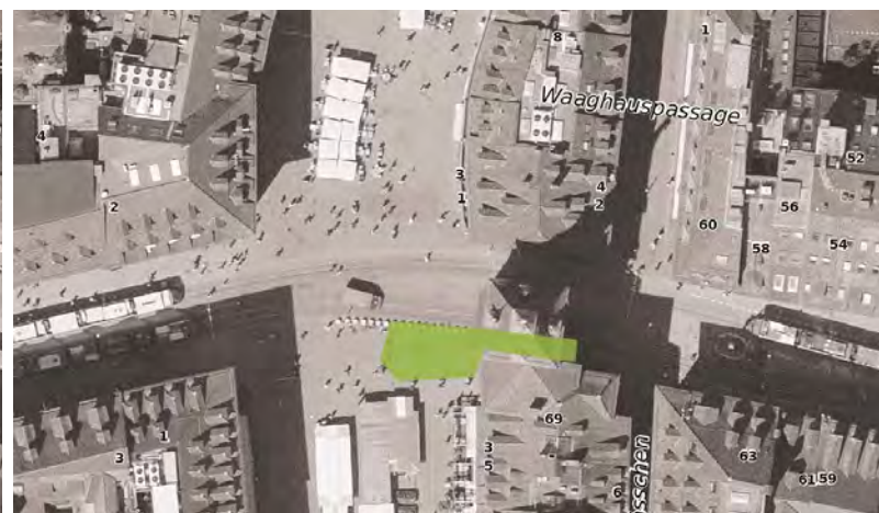
Abb.17: Raum vor dem Politforum Bern- Soll-Situation