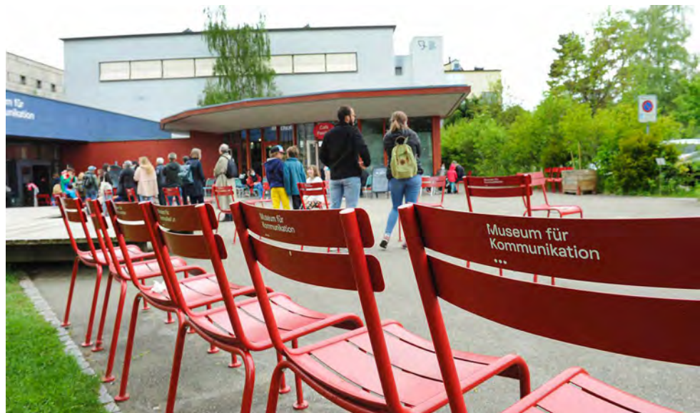
Abb. 1: Warteschlange vor dem Museum für Kommunikation

Nach der Wiedereröffnung Ende 2020 entstanden die eingangs beschriebenen, mäandernden Warteschlangen zum Teil auch vor den Museen, denn eine Auflage der Schutzkonzepte bedingte eine Beschränkung der Besucherzahl.