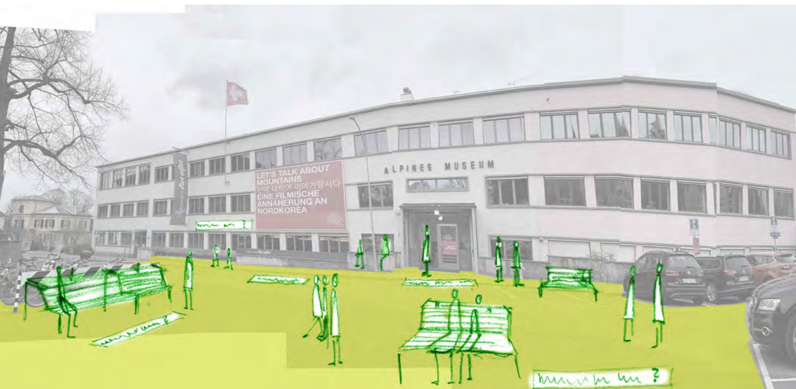
Abb.11: Visualisierung Alpinen Museum Bern

Vor dem Alpinen Museum gibt es viel Platz. Indem die Bordsteinkante des Trottoirs vor dem Museum entfernt wird, entsteht eine zusammenhängende Fläche hin bis zur Bushaltestelle. Die Parkplätze vor der Bushaltestelle werden verschoben. Die so entstandene Fläche vor dem Museum kann mit Farbe einen neuen Raum sichtbar machen. Auf diese Fläche können Interventionen bezüglich der momentan laufenden Ausstellung im Museum angebracht werden. Die Interventionen lassen Passant:innen innehalten und einen kurzen Moment den Bezug zum Innern des Museums machen. Die Fläche ist Oase zum Verweilen, Spielen und Gespräche führen.