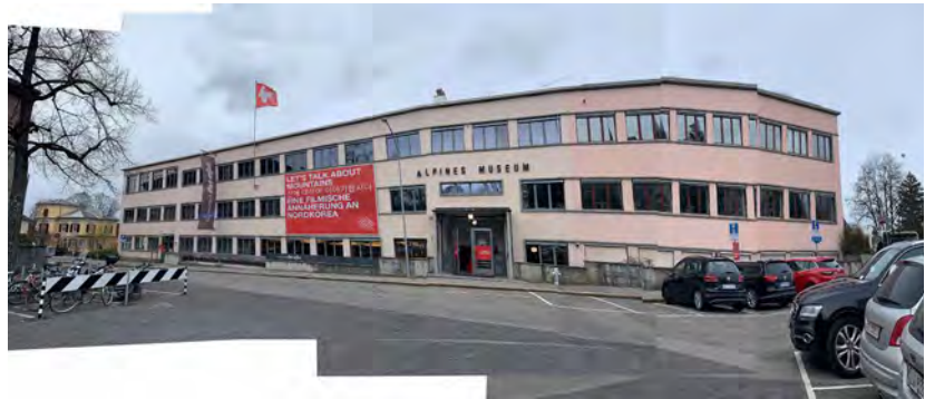
Abb.8: Alpinen Museum Bern

Der Eingang des Alpinen Museum liegt etwas abgewandt vom Fussgängerstrom am Helvetiaplatz. Die Beschriftung wirkt nüchtern, ganz nach der Architektur neues Bauen der 1930er Jahre. Vor dem Eingang findet man schützenden Raum vor Regen.