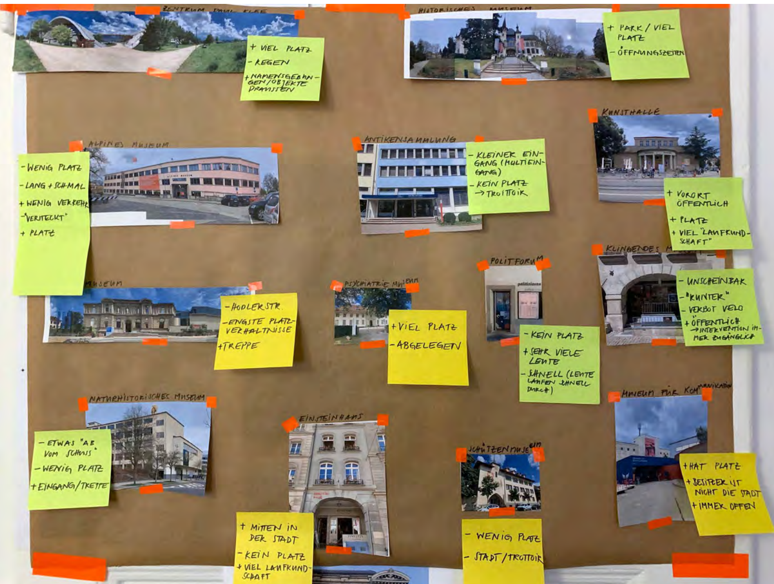
Abb.7: Berner Museen in der Stadt

Im Verlauf der Auseinandersetzung merke ich, dass ich gut daran tue, mich vorerst mal auf Berner Museen zu konzentrieren. Durch den Versuch, Eigenschaften und Kriterien aufzustellen, kann diese Arbeit übersetzt und auch auf Museen ausserhalb von Bern angewendet werden.