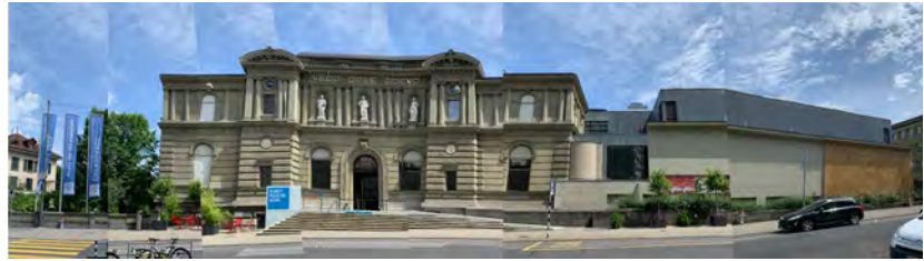
Abb.12: Kunstmuseum Bern

Das Kunstmuseum Bern ist eines der ältesten Museen der Schweiz. Die Wurzeln sind im ausgehenden 18. Jahrhundert zu finden. 1879 eröffnet der erste Museumsbau. Nach mehrfacher Erweiterung des Gebäudes steht das Kunstmuseum wieder vor einer Neuausrichtung (vgl. Kapitel 5). Seit August 2016 werden das Kunstmuseum und das Zentrum Paul Klee unter einer Direktion geleitet.