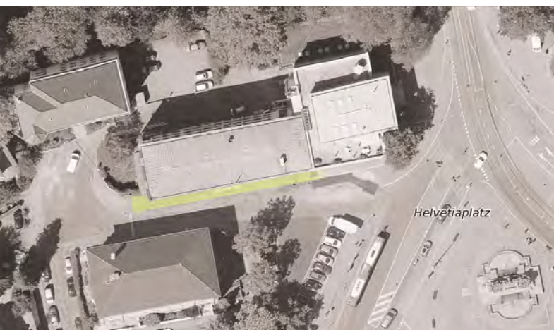
Abb.9: Raum vor dem Alpinen Museum Bern - Ist-Situation

Der Raum vor dem Alpinen Museum ist sehr klein und wird fast ausschliesslich für den Restaurantbetrieb genutzt (bei schönem Wetter). An diesen Raum stösst das Trottoir und eine wenig befahrene Quartierstrasse an. Vor dem Eingang breitet sich ein Teil des Helvetiaplatzes aus. Dieser Raum wird als Parkplatz genutzt.