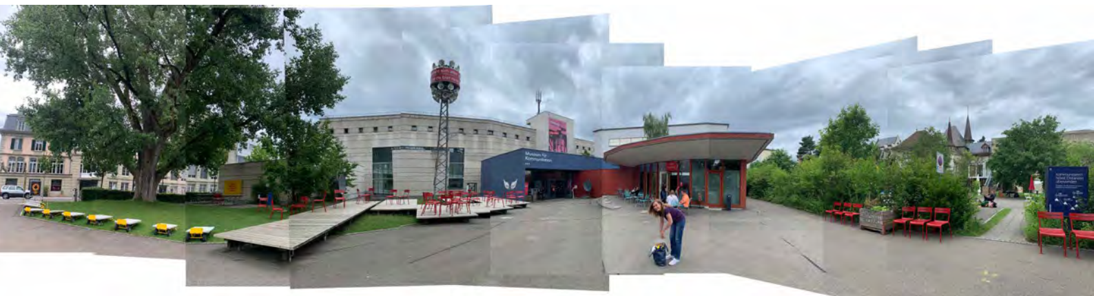
Abb.6: Promenade des Museum für Kommunikation

Das Gespräch mit Gallus beantwortet viele meiner eingangs gestellten Fragen und Überlegungen (siehe Seite 5). Das Einbeziehen der Promenade in die Vermittlungsarbeit finde ich grossartig und deshalb ist das MfK in dieser Hinsicht ein Vorzeige-Beispiel.