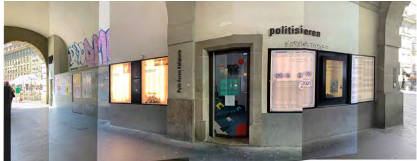
Abb.15: Politforum Bern

Das Politforum Bern befindet sich im Käfigturm, mitten in der Altstadt von Bern. Meine Wahl fällt auf diese Institution, da sie wirklich mitten im Berner Alltag steht. Der Turm erinnert an einen Ameisenhaufen; das Berner Volk strömt tagein, tagaus durch den Käfigturm hindurch.