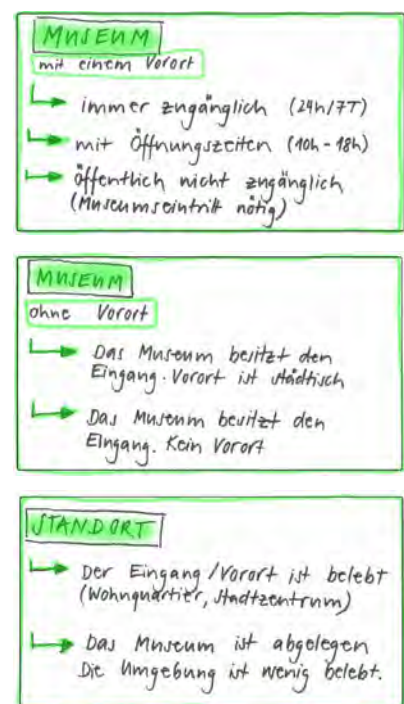
Abb.5: Skizzen zu Vorplatz und Standort

Hier möchte ich kurz meine Gedanken zu gastronomischen Angeboten vor Museen erläutern. Ich finde es wichtig, auf diesen Punkt kurz einzugehen und meine Haltung in Verbindung zu meiner Arbeit darzulegen. Ein gastronomische Konzept lässt den Raum vor einem Museum attraktiv erscheinen und zieht Publikum an. Sich zu setzen und etwas zu konsumieren kann auch während des Museumsbesuchs eine angenehme