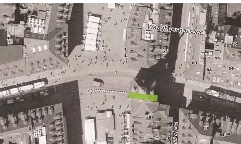
Abb.16: Raum vor dem Politforum Bern - Ist-Situation

Der Eingang des Politforums ist mitten im Durchgang des Käfigturms, man nimmt ihn beinahe nicht wahr; die geschäftigen Passanten:innen strömen am Eingang vorbei. Diese Schnelligkeit reizt mich und fügt in der Diskussion Vorort vorOrt einen neuen Aspekt bei. Der Vorplatz ist hier schwer zu definieren - vorne ist hinten und umgekehrt. Direkt vor dem Eingang ist der Platz beschränkt. Im Westen vor dem Turm (ausserhalb der Fussgängerpassage) befindet sich eine öffentlich zugängliche Sitzbank, welche z.T. auch von den Restaurants benutzt wird. Die Ostseite des Turms ist für einen Vorplatz zu eng. Der Raum vor dem Museum liegt auf städtischem Grund und ist 24h/7 Tage zugänglich.