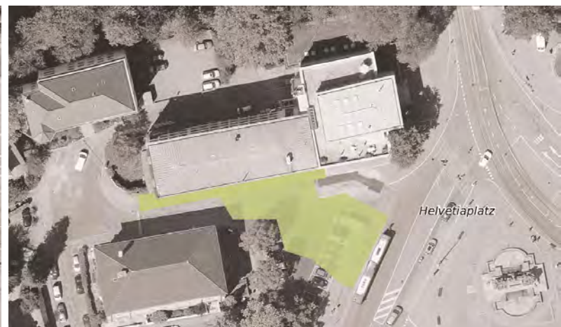
Abb.10: Raum vor dem Alpinen Museum Bern - Soll-Situation