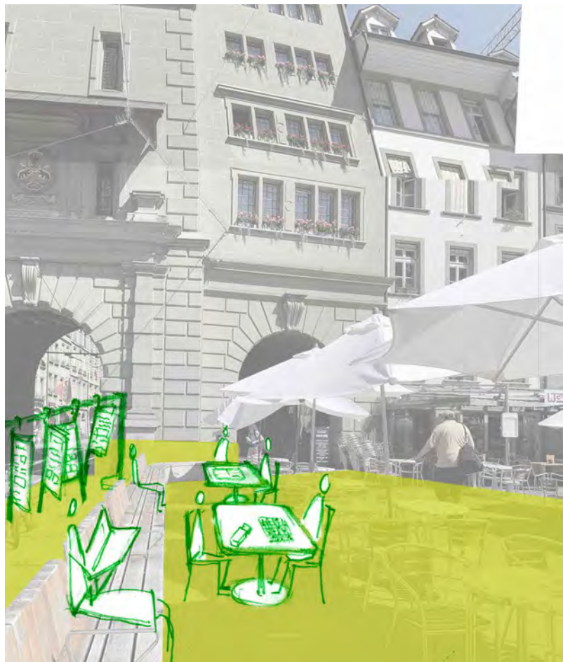
Abb.18: Raum vor dem Politforum Bern- Soll -Situation

Um das Politforum direkt vor Ort sichtbar zu machen, stehen anstelle von Restauranttischen zum Beispiel zwei Spieltische zur freien Benutzung da. Um zusammen spielen zu können, muss man sich an Regeln halten, die vorgängig definiert werden. So funktioniert auch das – politische – Zusammenleben unserer Gesellschaft. Die Tische laden zu kürzeren oder längeren Spielen ein - eine spielerische Erweiterung des Politforums. Die Tischfläche dient dem Politforum als Kommunikationsfläche. Über diese Fläche kann die Bevölkerung auf die Themen des Politforums aufmerksam gemacht werden.