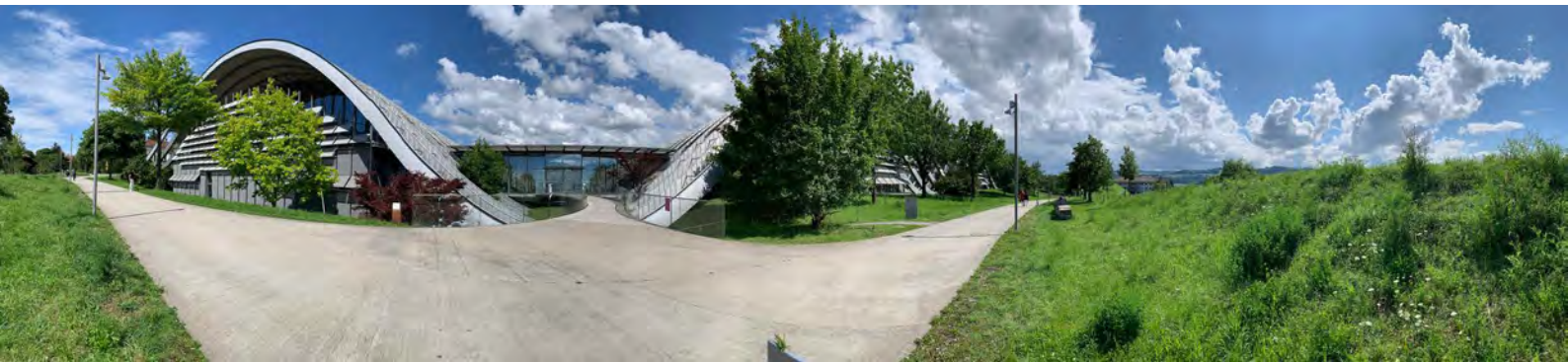
Abb.4: Raum vor dem Zentrum Paul Klee

Jede Museumssituation ist einzigartig und doch gibt es Gemeinsamkeiten, die auf alle Museumseingänge zutreffen. Nach eingehender Betrachtung der verschiedenen Museumseingänge und der Fragen, die ich mir am Anfang gestellt habe, teile ich die Museen verschiedenen Kategorien zu. Es gibt Museen mit einem Vorplatz. Dieser Vorplatz kann immer zugänglich sein (24h/7Tage), ist während Öffnungszeiten zugänglich oder ist nicht öffentlich zugänglich (man muss z.B. einen Museumseintritt lösen, um den Vorplatz des Museum zu betreten).