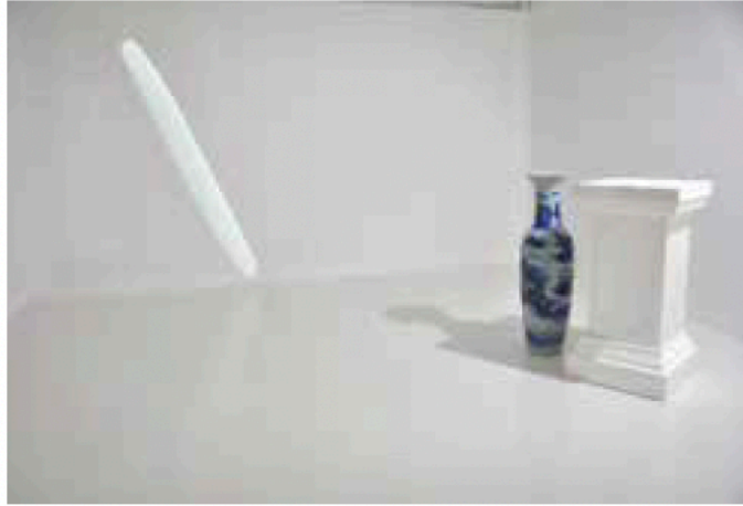
Translation, du sillon du vaisseau #2 2013