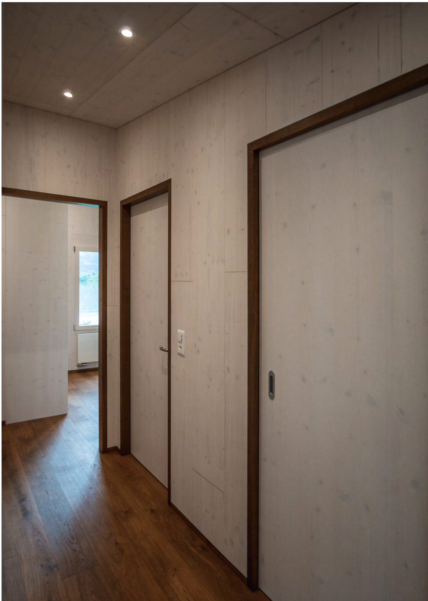
Haus am See, Seedorf Umbau, 2021