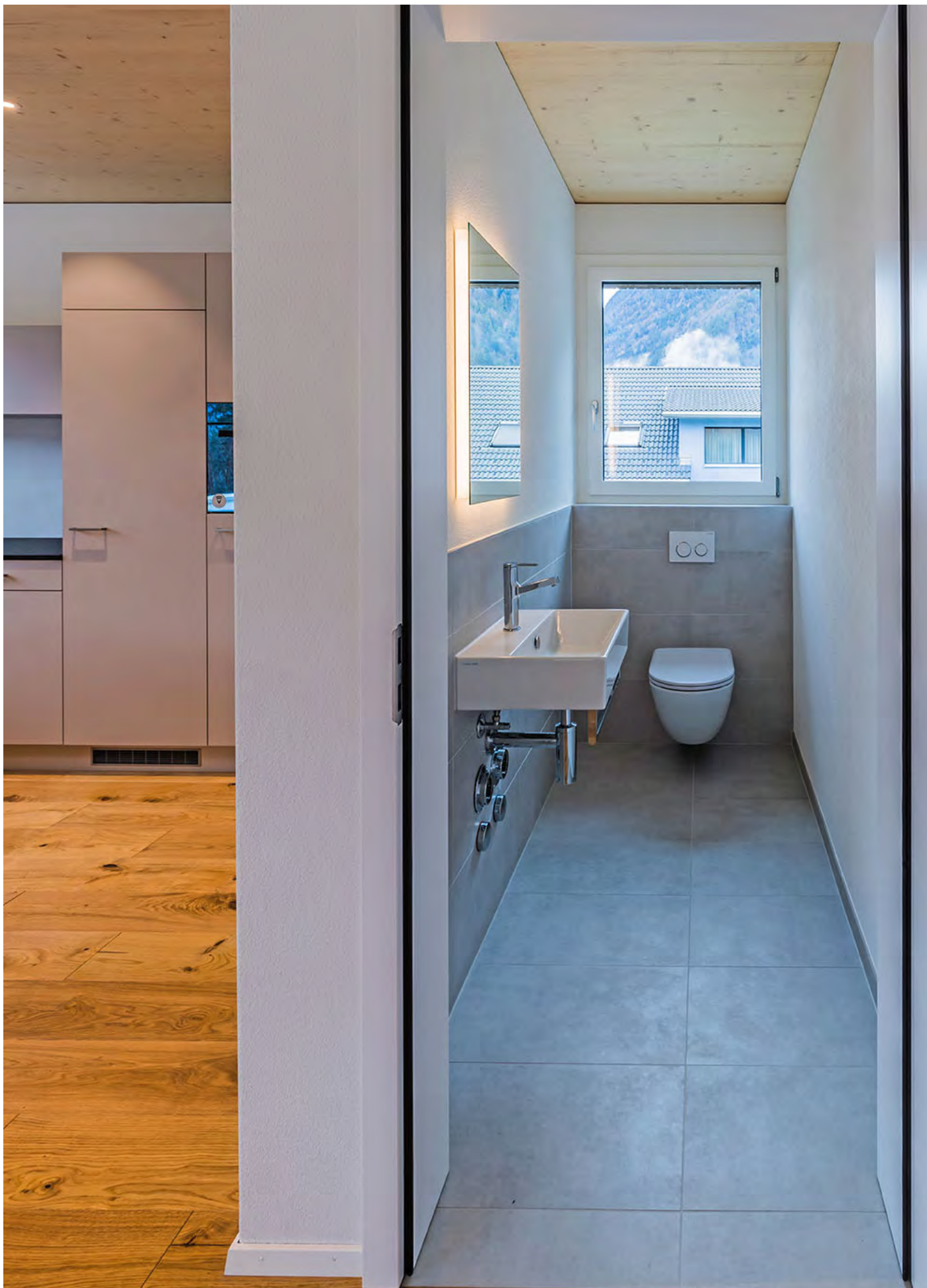
Haus Imholz, Bürglen Neubau, 2020