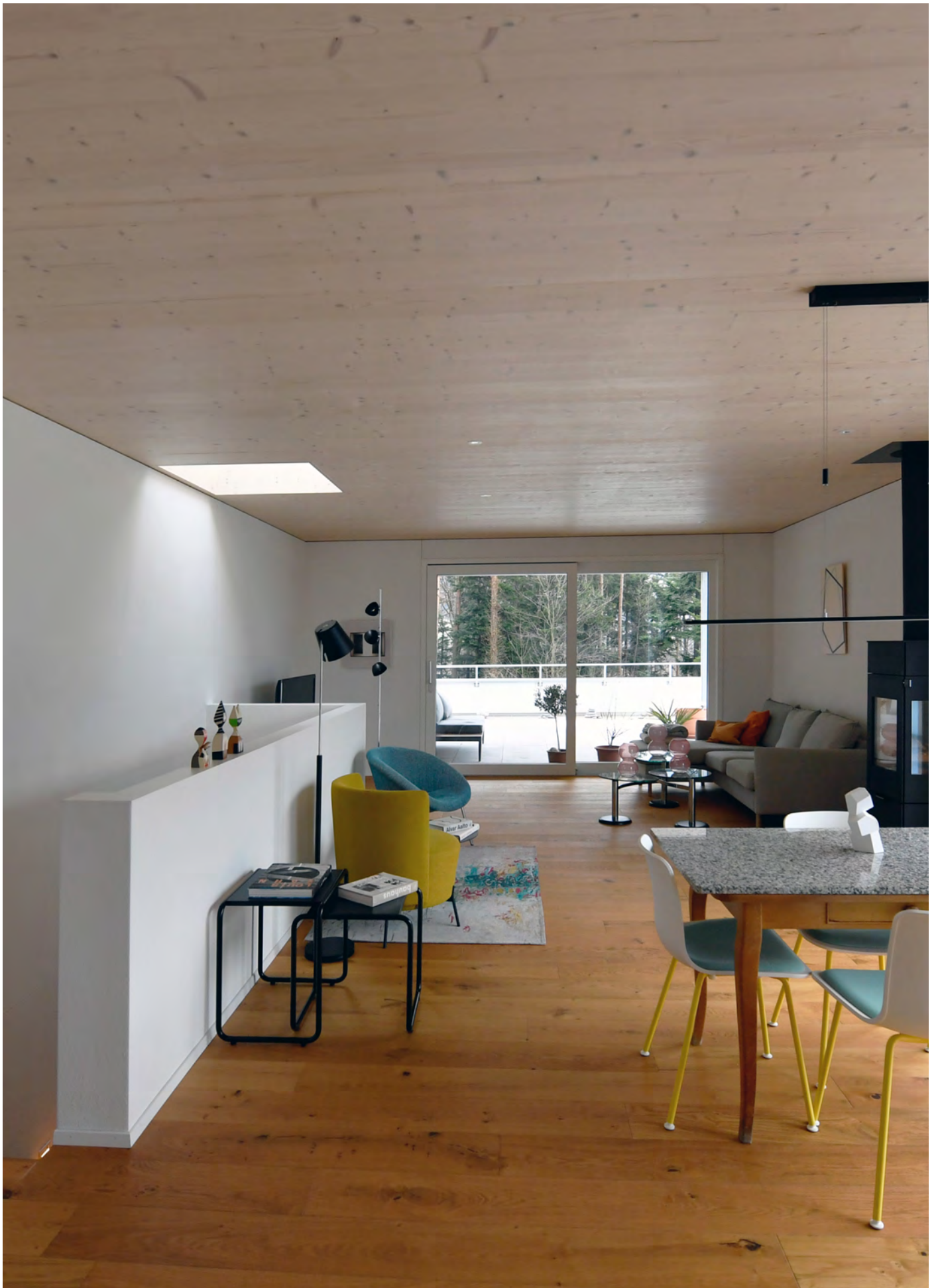
Haus Imholz, Bürglen Neubau, 2020, Foto: Reto Scheiber