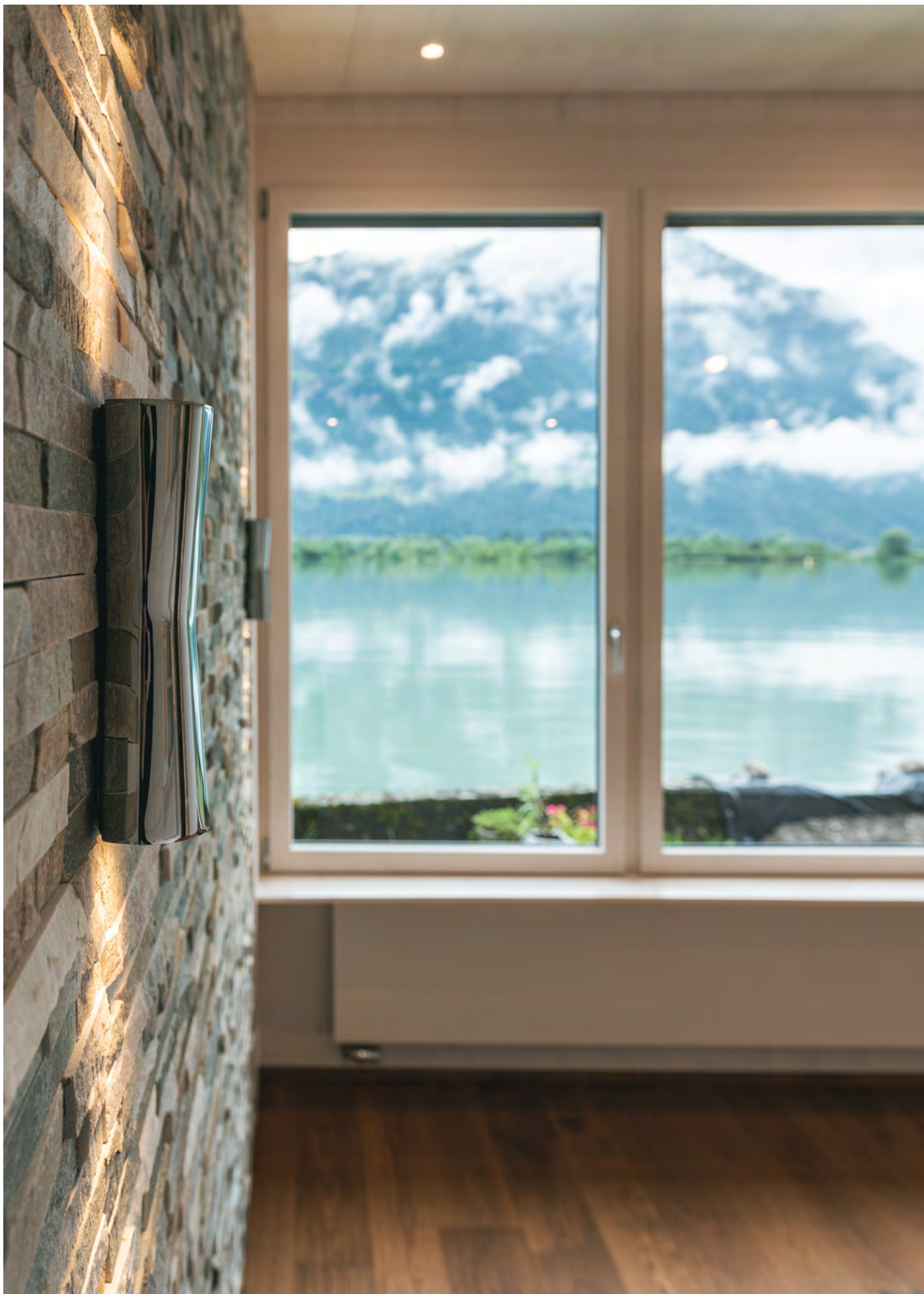
Haus am See, Seedorf Umbau, 2021