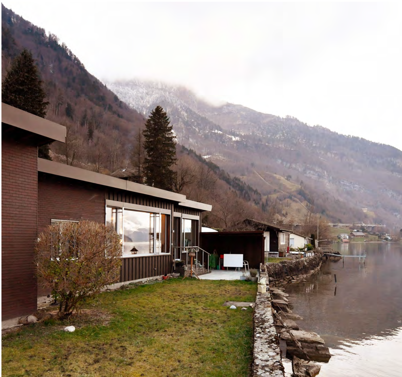
Haus am See, Seedorf Umbau, 2021