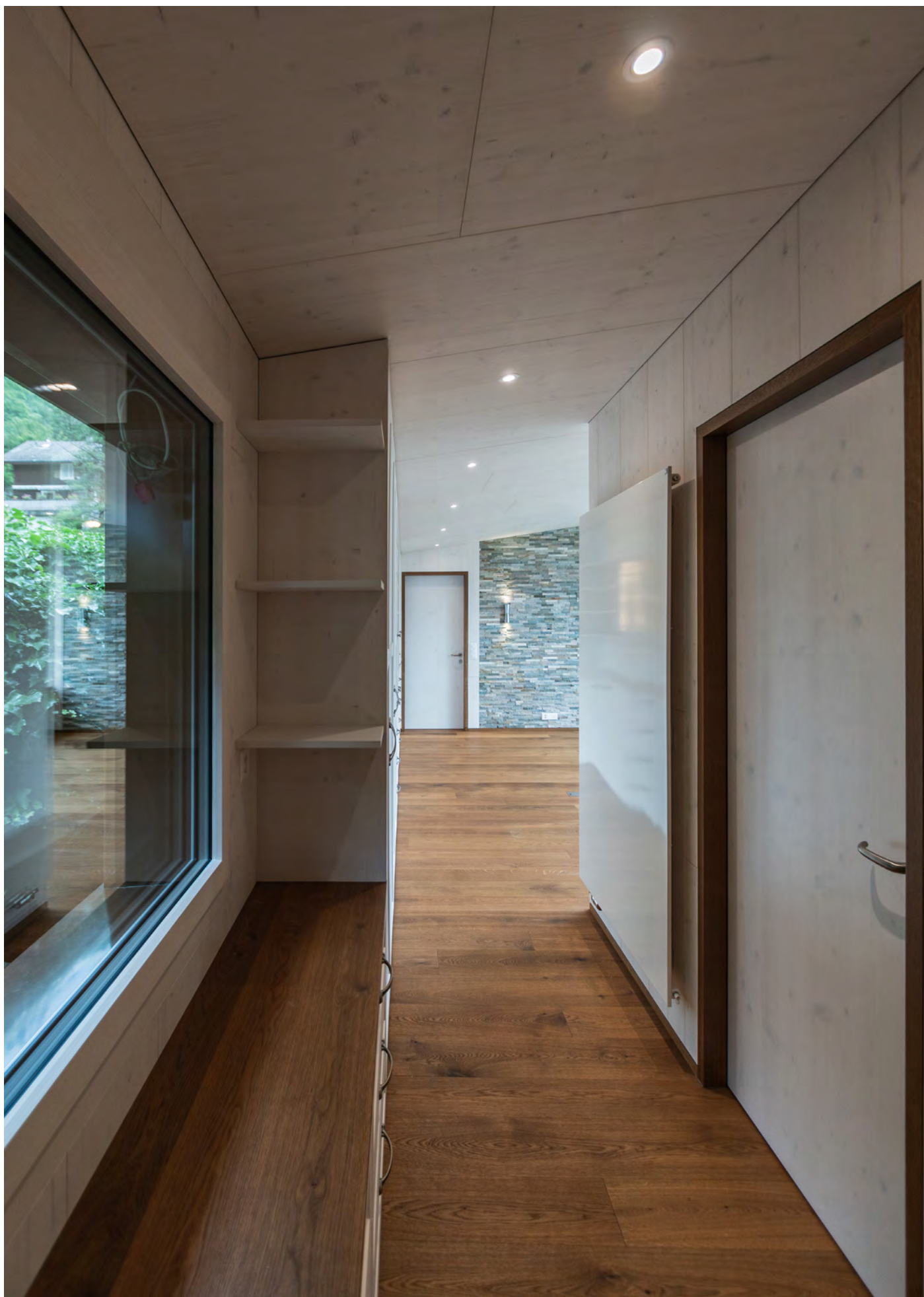
Haus am See, Seedorf Umbau, 2021, Foto: Jon Trachsel