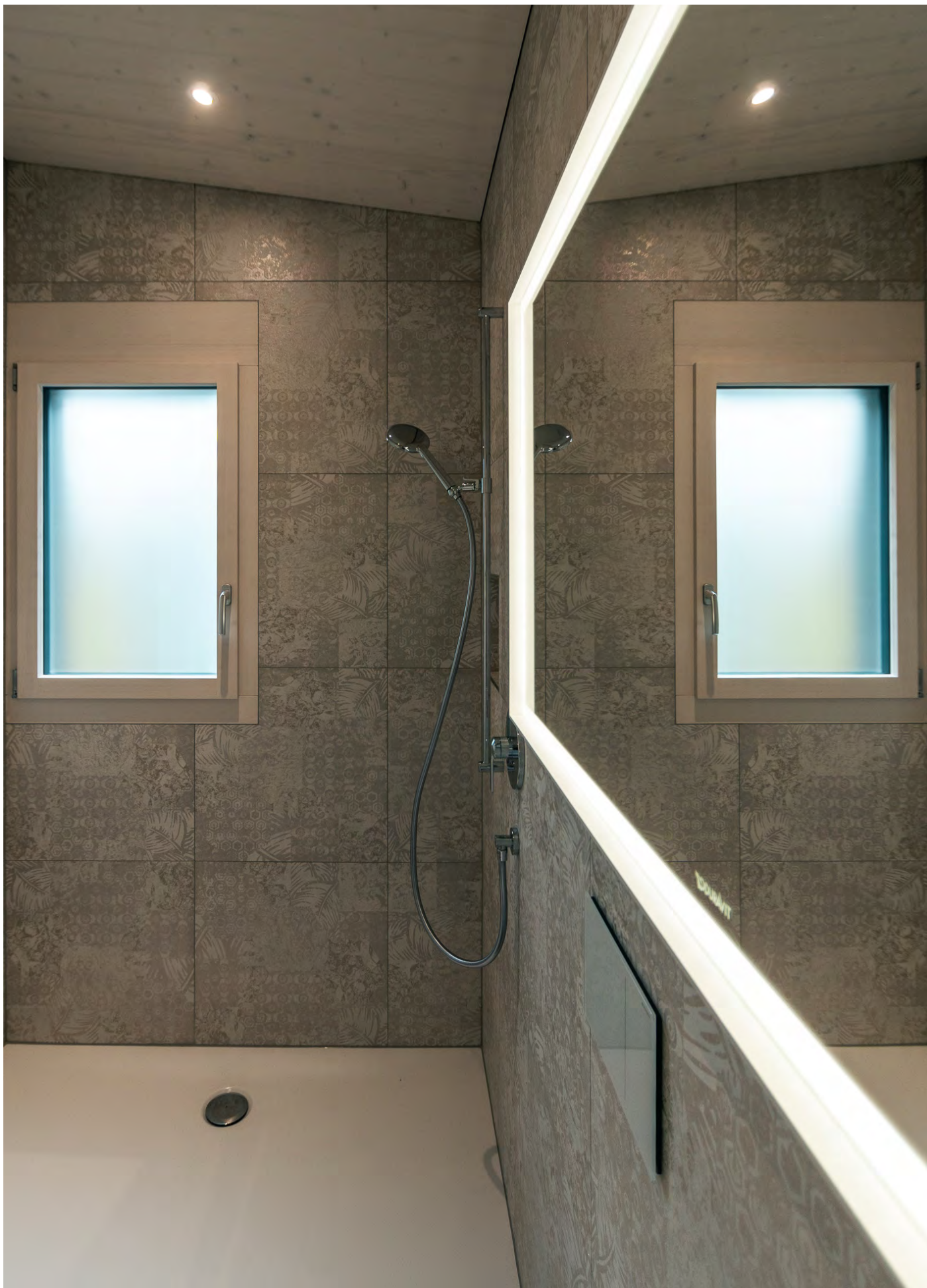
Haus am See, Seedorf Umbau, 2021