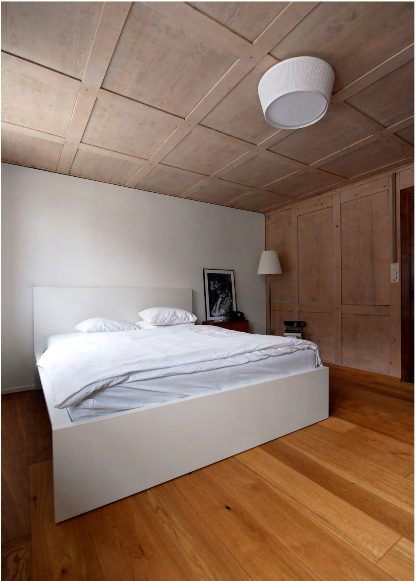
MFH Belimatte, Bürglen Um- und Anbau, 2019