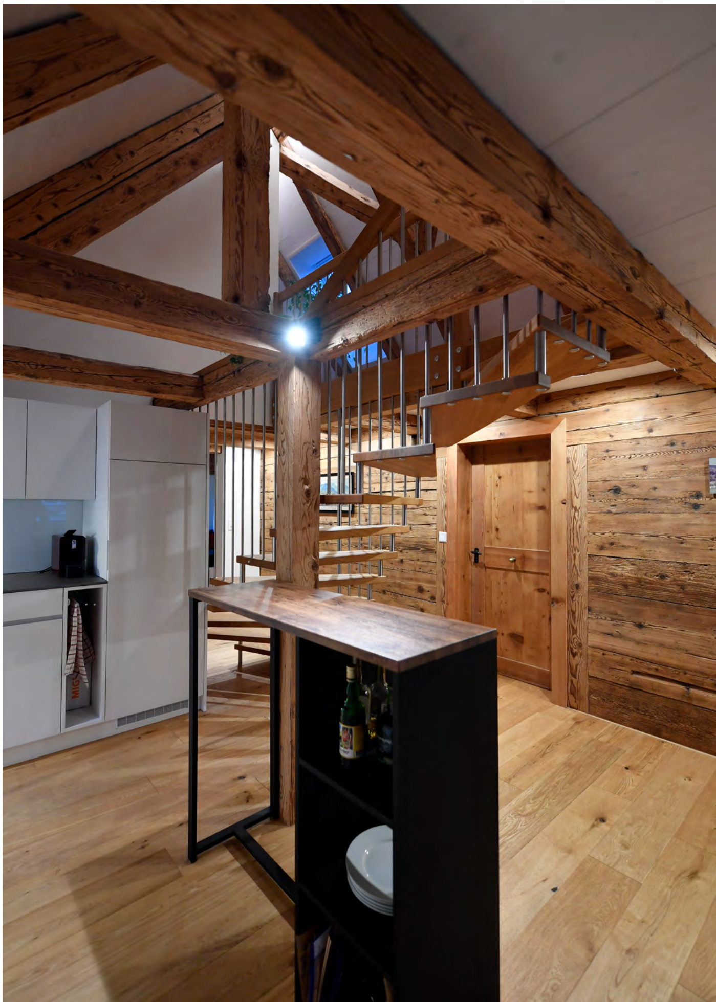
MFH Belimatte, Bürglen Um- und Anbau, 2019