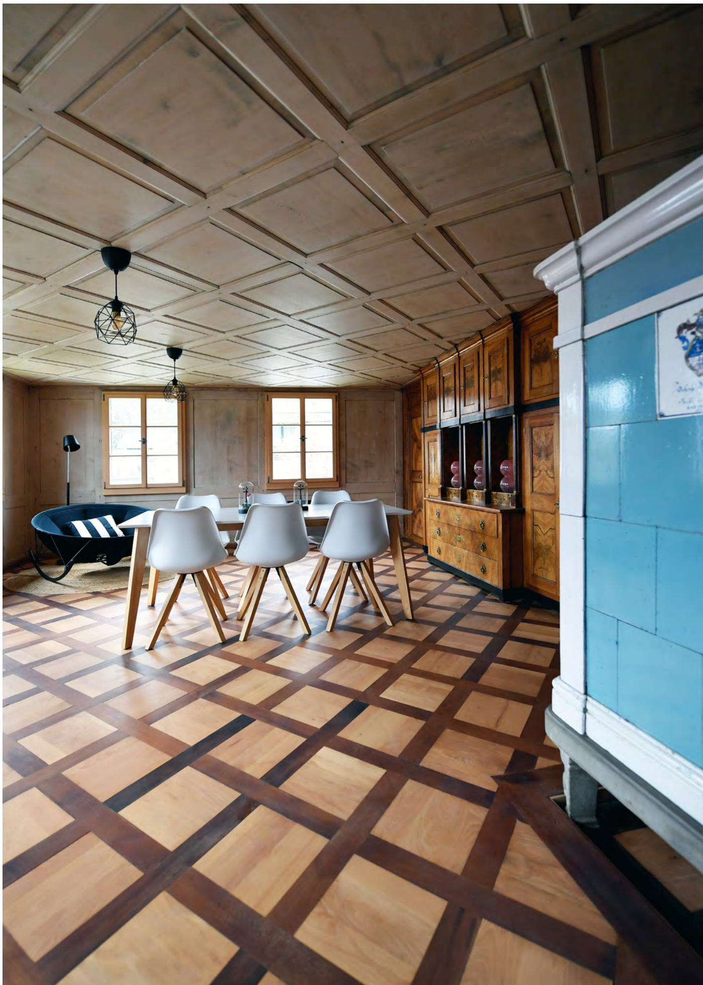
MFH Belimatte, Bürglen Um- und Anbau, 2019