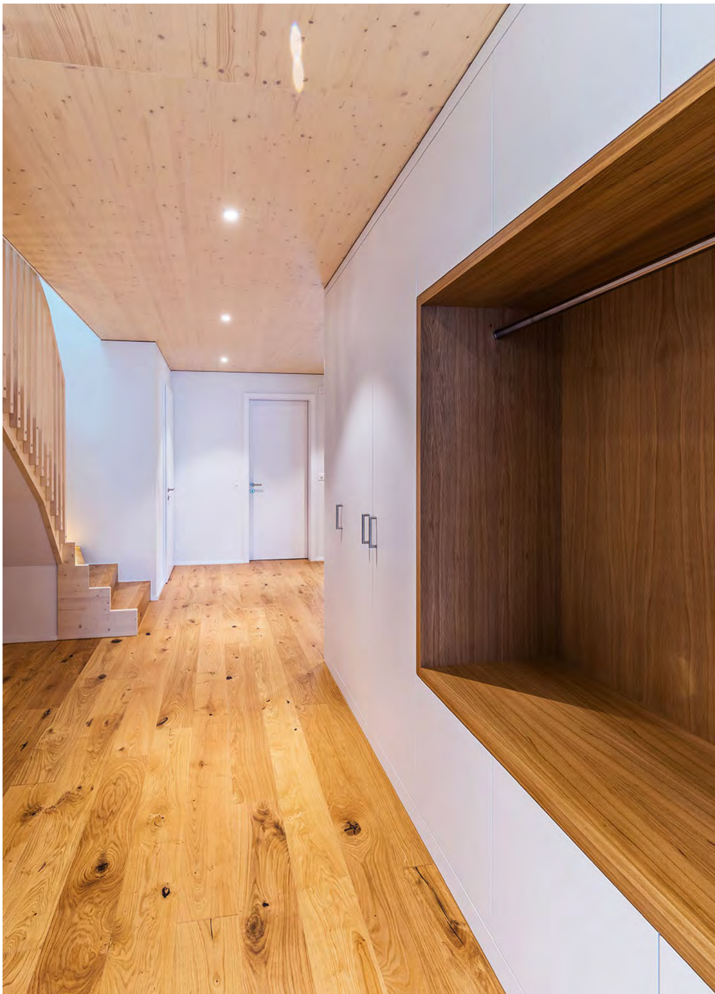
Haus Imholz, Bürglen Neubau, 2020