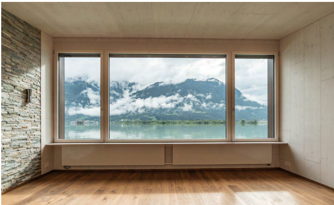
Haus am See, Seedorf Umbau, 2021