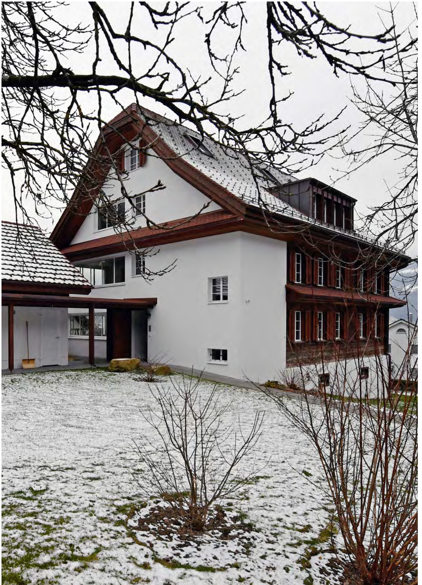
MFH Belimatte, Bürglen Um- und Anbau, 2019, Foto: Reto Scheiber