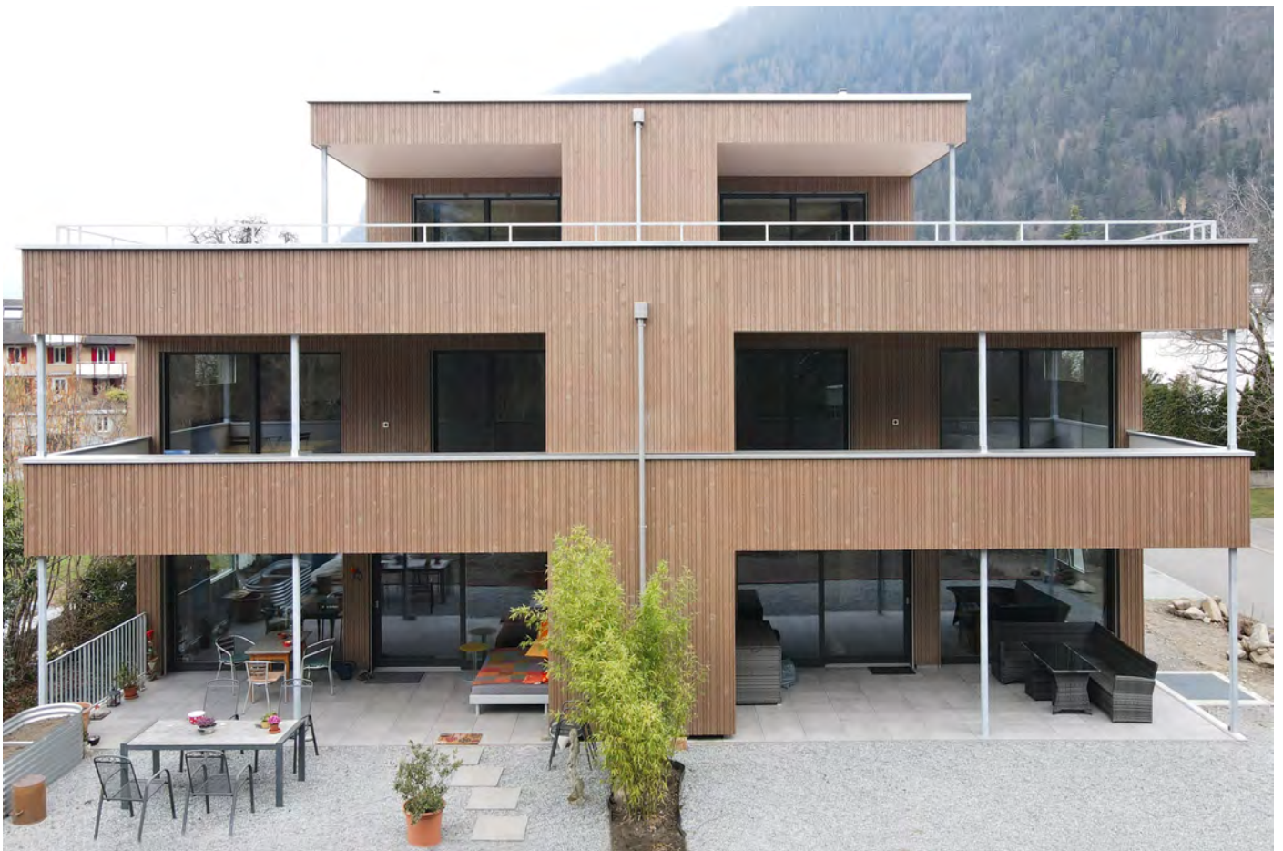
Haus Imholz, Bürglen Neubau, 2020, Foto: Dave Schuler