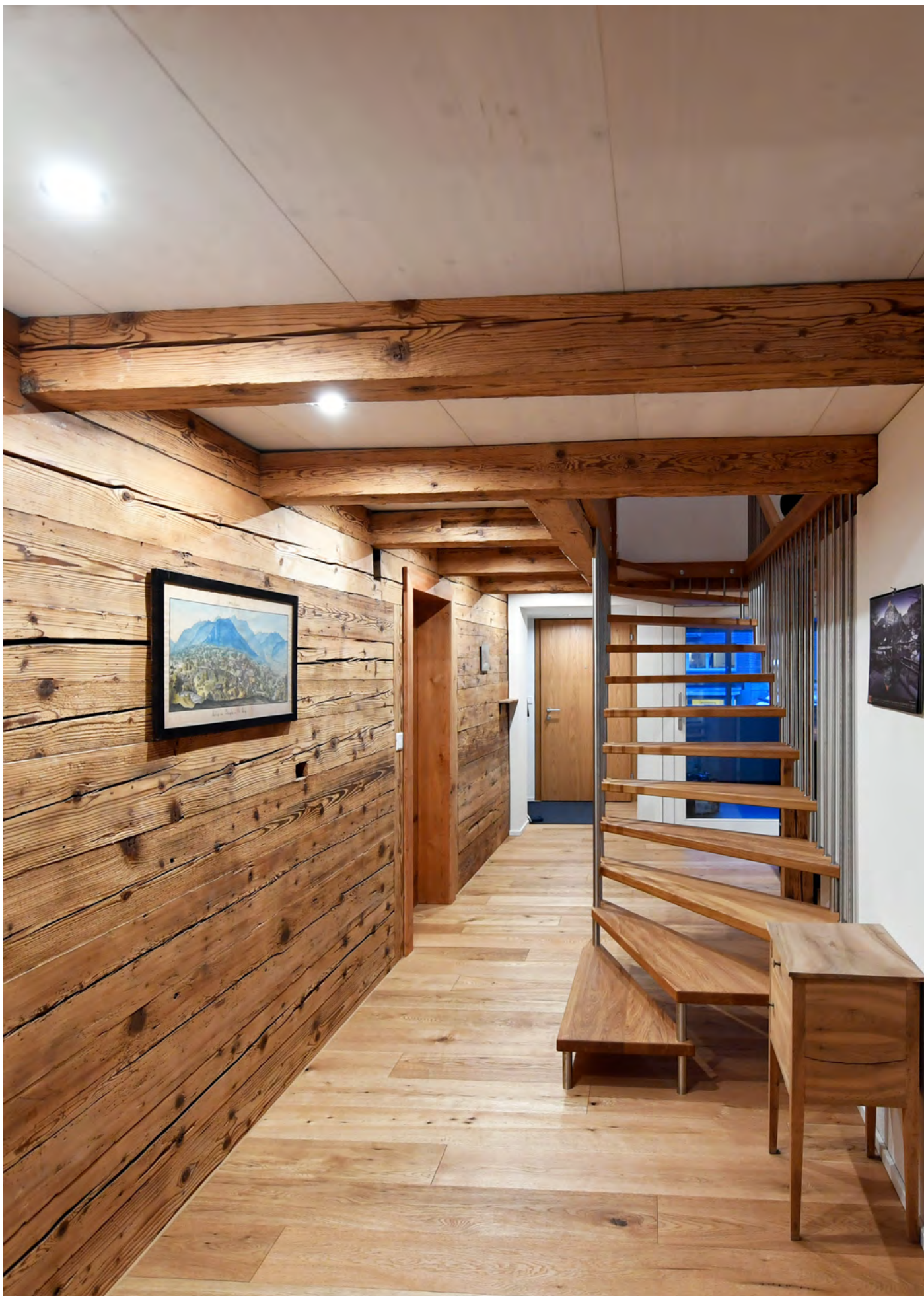
MFH Belimatte, Bürglen Um- und Anbau, 2019