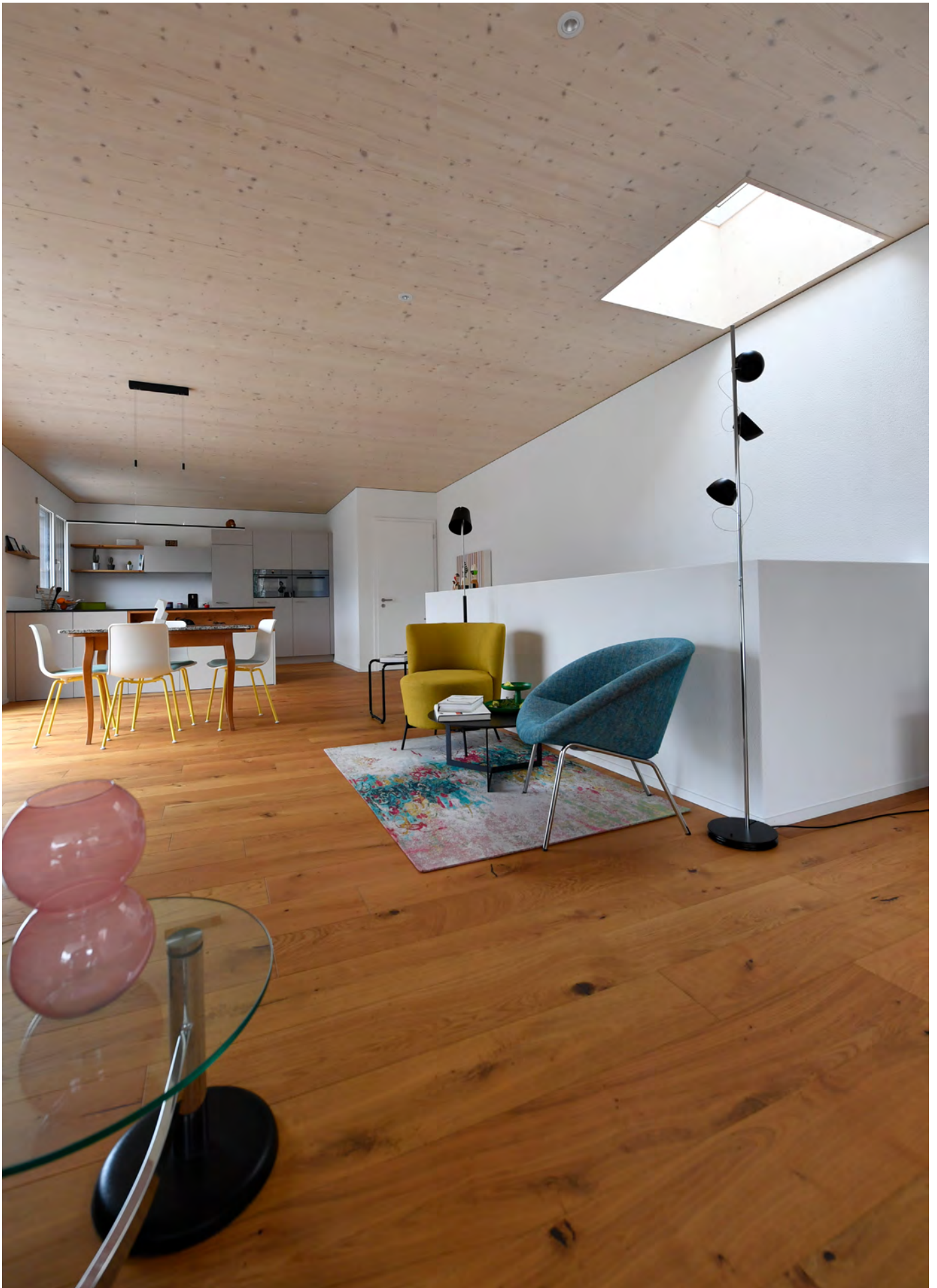
Haus Imholz, Bürglen Neubau, 2020, Foto: Reto Scheiber