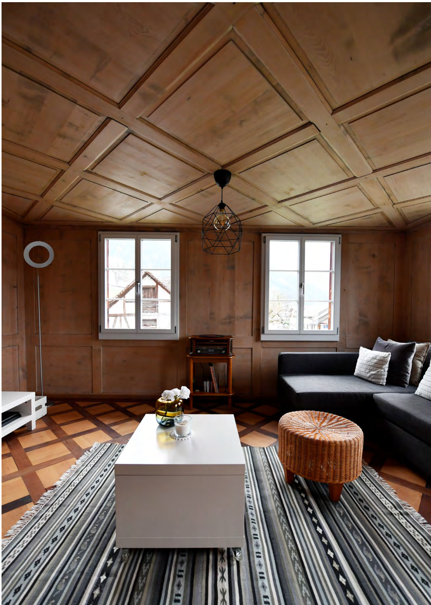
MFH Belimatte, Bürglen Um- und Anbau, 2019