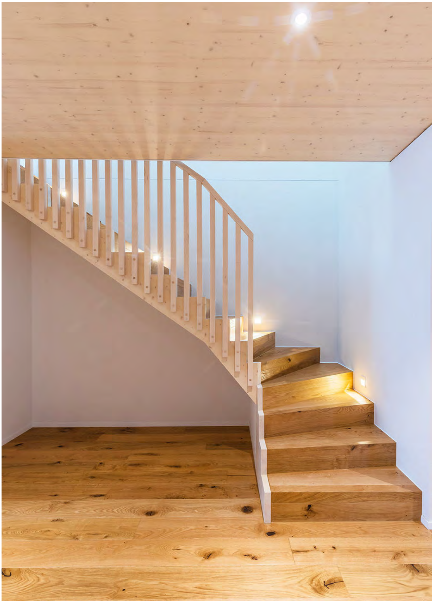
Haus Imholz, Bürglen Neubau, 2020, Foto: Armin Lauber