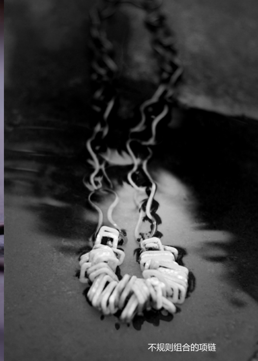
不规则组合的项链