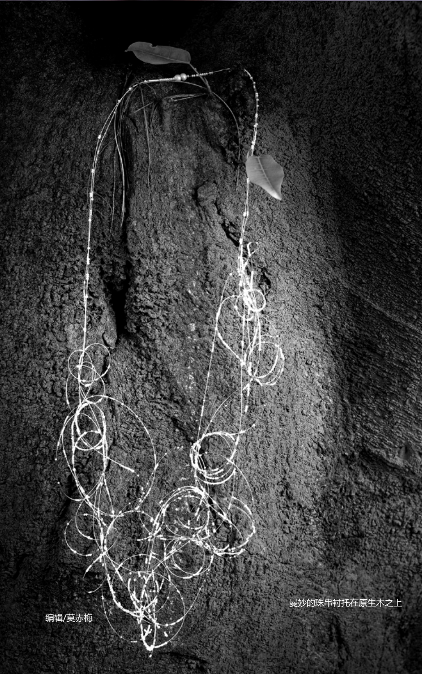
曼妙的珠串衬托在原生木之上