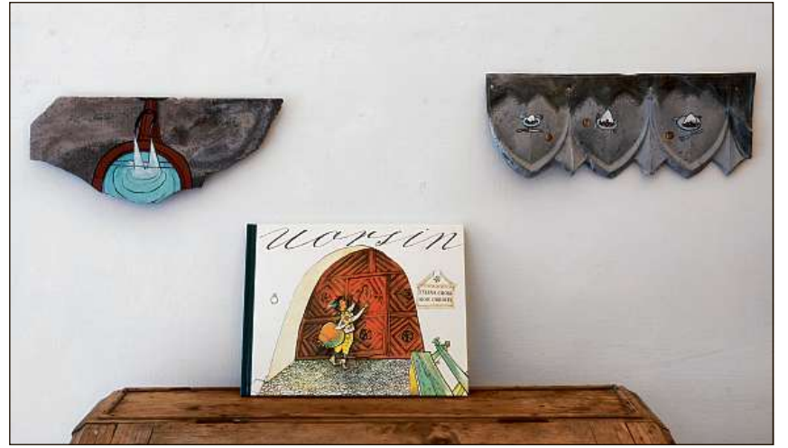
Sujets d'Uorsin malegiai sin material curdau dalla Casa Carigiet duront e suenter igl incendi.