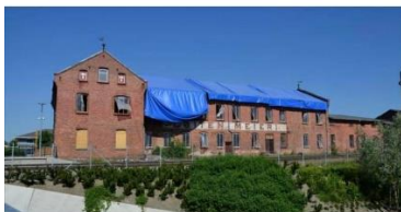
H-A.NO (Abo) Politikere gjør helomvendning – stanser kjøp til 60 millioner i siste liten

Da har det kommet et litt bud for å se mer