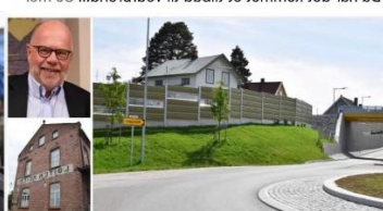
OSTLENDINGEN.NO (+) La frem konkurrerende tilbud – led liker å se et sjanse, og jeg liker å se svarer

Dagens leder i Østlendingen – «Det gir ikke mening å kjøpe et bygg til 60 millioner uten å se på andre løsninger først.» Kommunestyret den 2. juni bestemmer. Arbeiderpartiet mener man må få flere løsninger til vurdering.