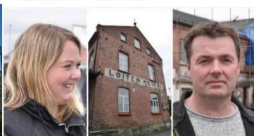
OSTLENDINGEN.NO (+) Stoppet omstridt kjøp i Løten – nå blir det anbudsrunde