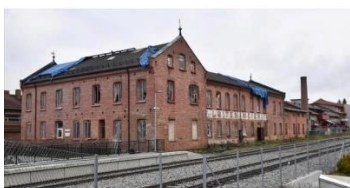
E-PAGES.DK Tid er penger

«Aldri har vi vel fått så lite dokumentasjon og blitt bedt om å bruke så mye penger!» ... Se mer