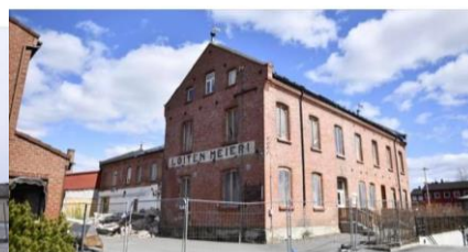
DEBATT.H-A.NO 60 millioner i Løten - vi må sette på bremsen mens det enda er mulig - HA Debatt

Vi fikk stoppet saken, og fikk gjennomslag for at man måtte følge anskaffelsesprosedyrer. Da saken kom opp på ny – for at man skulle gi noen signaler til kommunedirektør – hadde ordfører tegnet et så snevert sentrumskart som legesenter skal lokaliseres innenfor at det fortsatt vil være en «het politisk potet» hvordan SP bruker flertallsmakta i Løten-demokratiet og særlig i legesentersaken.