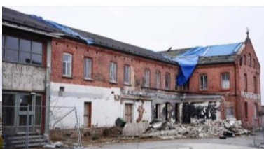
H-A.NO (Abo) Utsetter legesenter-avgjørelsen: – Bare tull at det ikke finnes andre muligheter, sier utbygger