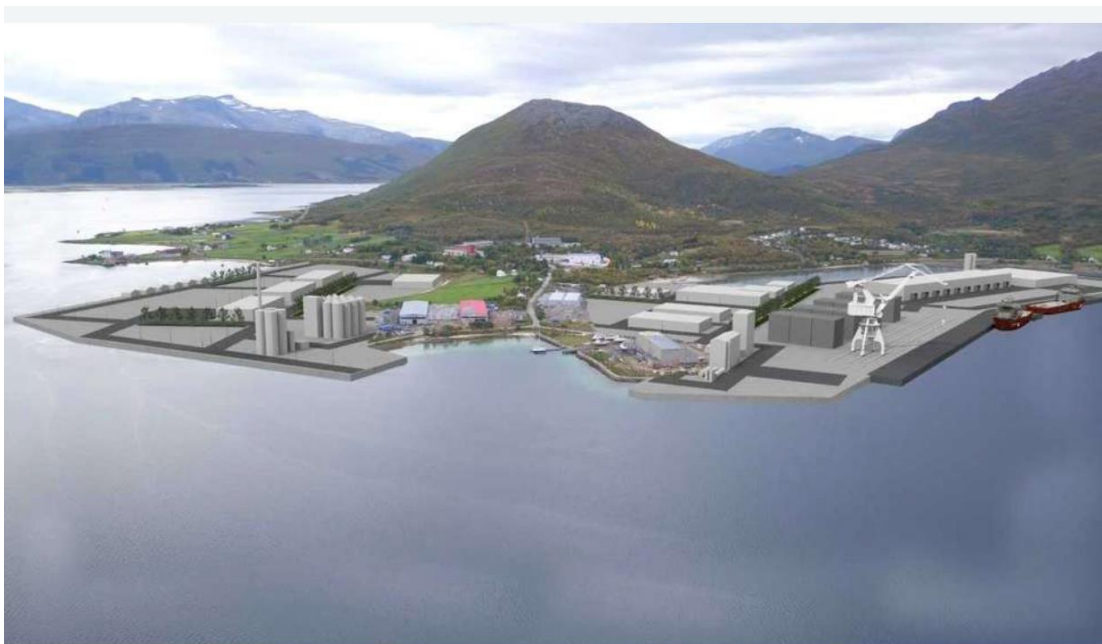
Rødskjer og Evenskjer