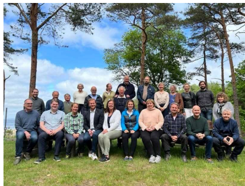
Østre Bolærne, Færder nasjonalpark.

Det politiske året 2022 har vært svært krevende, særlig nasjonalt og internasjonalt. Som regionalt nivå har også vi blitt berørt av alle de store hendelsene som slo inn med full kraft; Krig i Europa, energikrise, renteøkning og generelle høye priser.