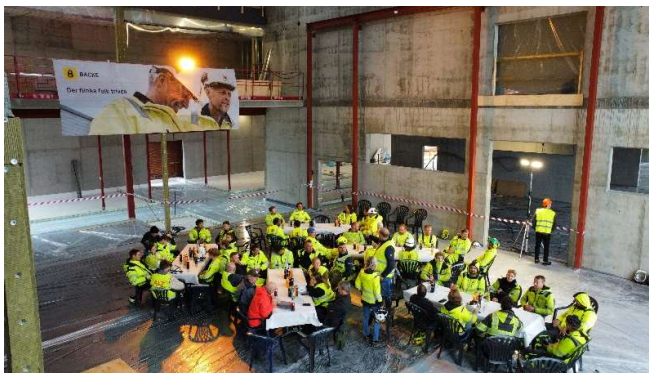
Miljø fra nye Bamble videregående skole.

Leder Partssammensatt utvalg fra 15.oktober: Maja Foss Five