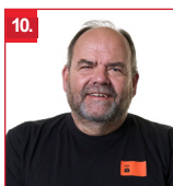
10. Helge Haaland