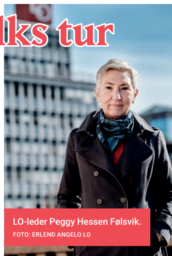
LO-leder Peggy Hessen Følsvik.