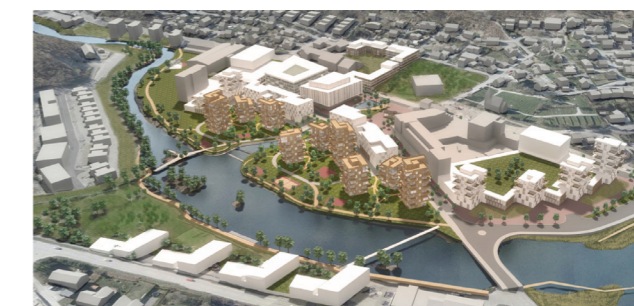
ILLUSTRASJONER: Gjesdal Kommune/C.F. Møller