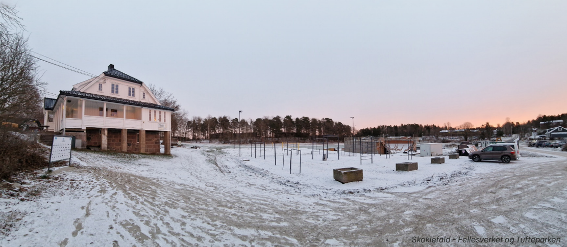
Skolefald - Fellesverket og Tufteparken