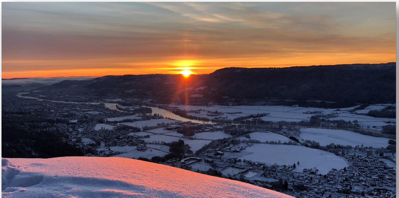
Soloppgang på Knabben 24. Desember 2018