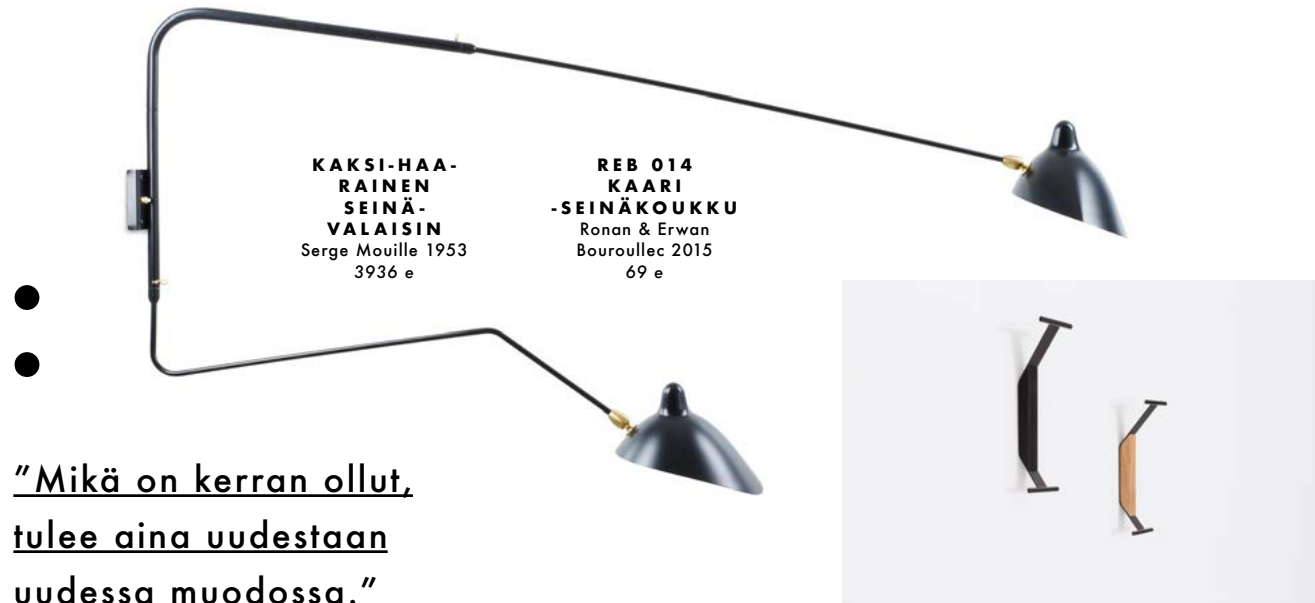
KAKSI-HAA-RAINEN SEINÄ-VALAISIN Serge Mouille 1953 3936 e