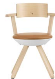
KG002-TUOLI ”RIVAL” Konstantin Grcic 2014 750 e