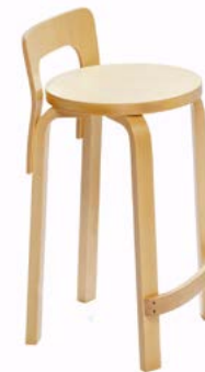
K65- TYÖTUOLI Alvar Aalto 1935 405 e