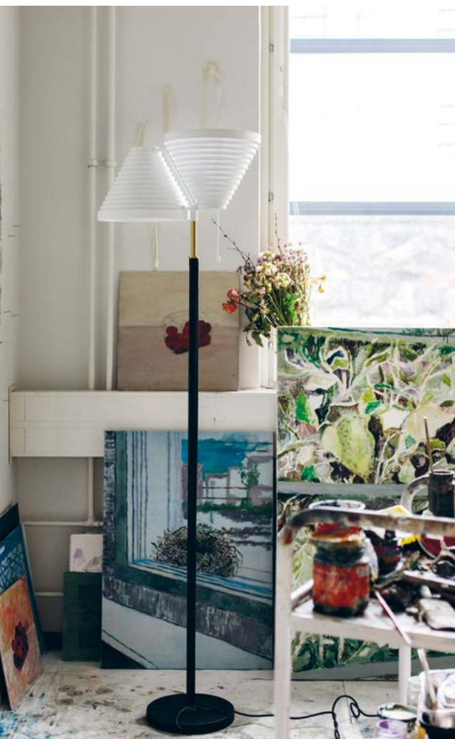
A810-LATTIA- VALAISIN Alvar Aalto 1959 1850 e