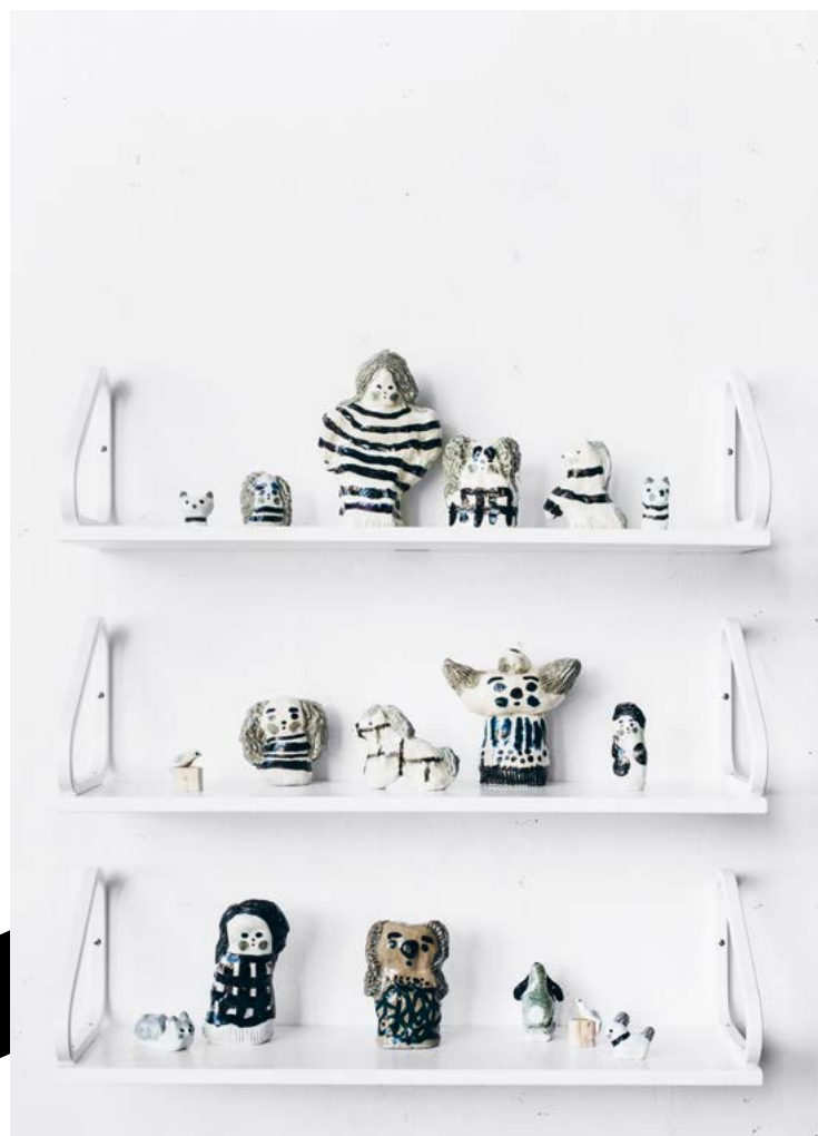
112B-SEINÄ- HYLLY, MAALATTU VALKOINEN Alvar Aalto 1936 350 e

"Kauneus on tulos, ei lähtökohta." -Alvar Aalto 1928