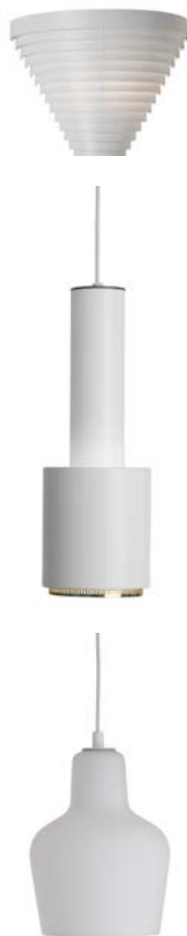
A440-RIIPPU- VALAISIN, OPAALILASIA Alvar Aalto 1954 519 e