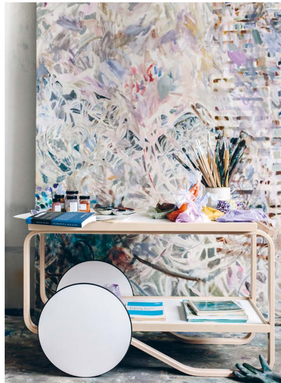
901-TARJOILU- VAUNU Alvar Aalto 1936 1855 e