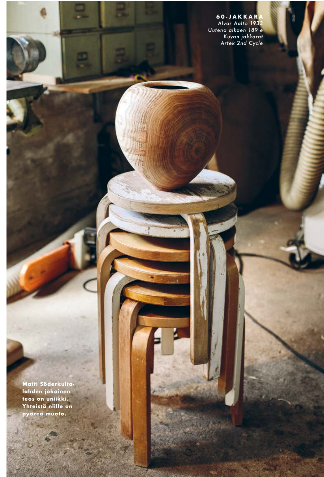
60-JAKKARA Alvar Aalto 1933 Uutena alkaen 189 e Kuvan jakkarat Artek 2nd Cycle