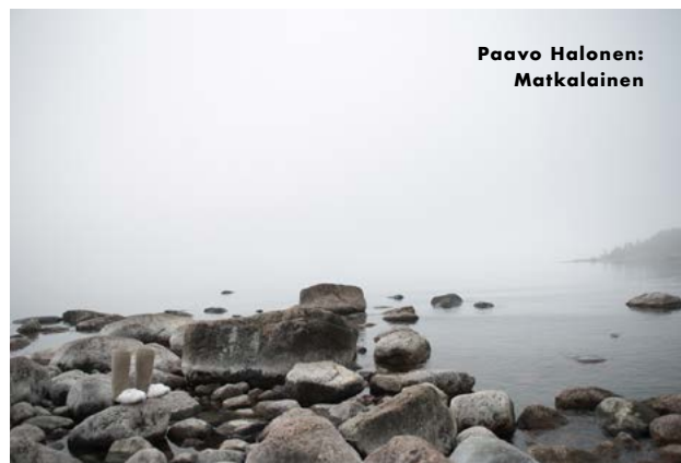
Paavo Halonen: Matkalainen

Tiesitkö? Artekin sisustusammattilaiset ovat käytössäsi. Voit varata ajan sisustussuunnitteluun osoitteesta artekhelsinki@artek.fi tai käymällä liikkeessämme. Sisustussuunnitelma on ilmainen, jos se johtaa yli 2 500 euron huonekalu- tai valaisinostoksiin.