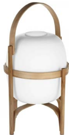
CESTA-VALAISIN Miguel Milá 1962 676 e