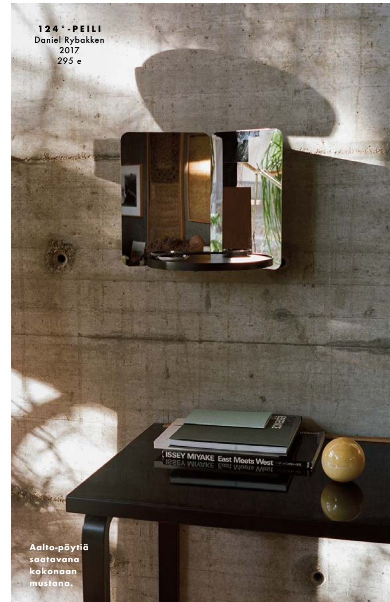
Aalto-pöytiä saatavana kokonaan mustana.