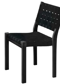
611-TUOLI, MUSTAKSI MAALATTU Alvar Aalto 1929 585 e